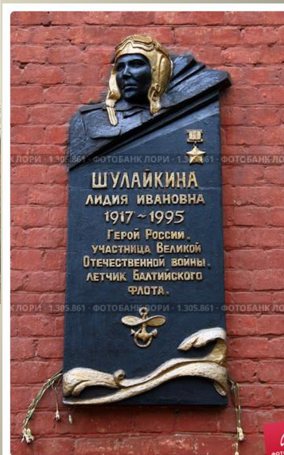
Орехово-Зуево. Памятная Доска на Доме.