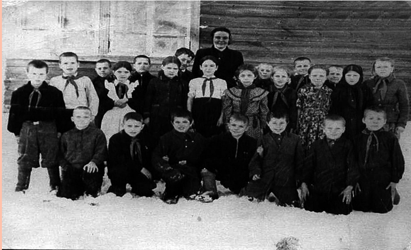
Средняя общеобразовательная политехническая школа с трудовым обучением