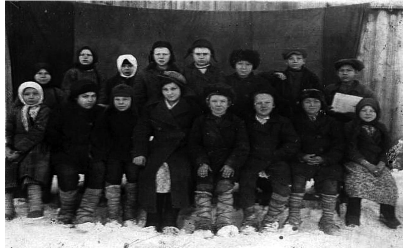
Учащиеся трехклассной земской школы

В сентябре 1938 года открылась средняя общеобразовательная политехническая школа с трудовым обучением. Зданий школы было четыре: кулацкий дом, два двухэтажных купеческих и деревянная (новая)