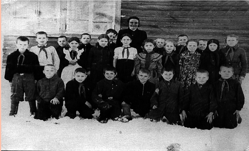
Средняя общеобразовательная политехническая школа с трудовым обучением