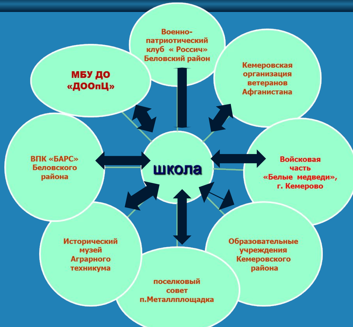
Схема связей патриотического воспитания в школе.