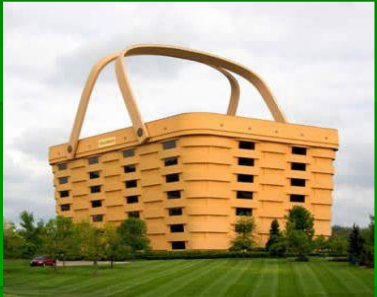
Дом «Корзина». Штат Огайо, США