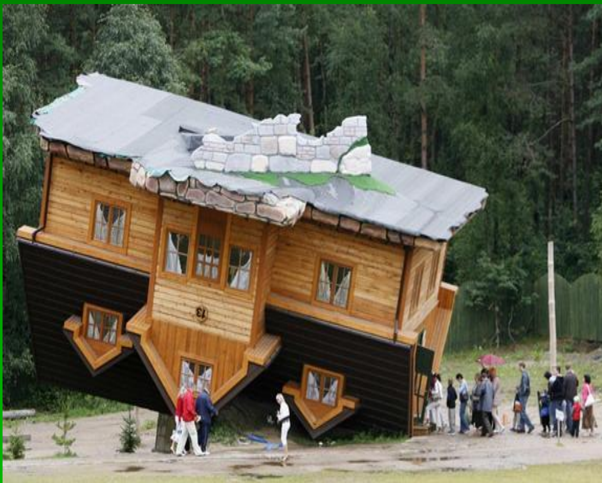
Перевернутый дом. Шимбарк, Польша