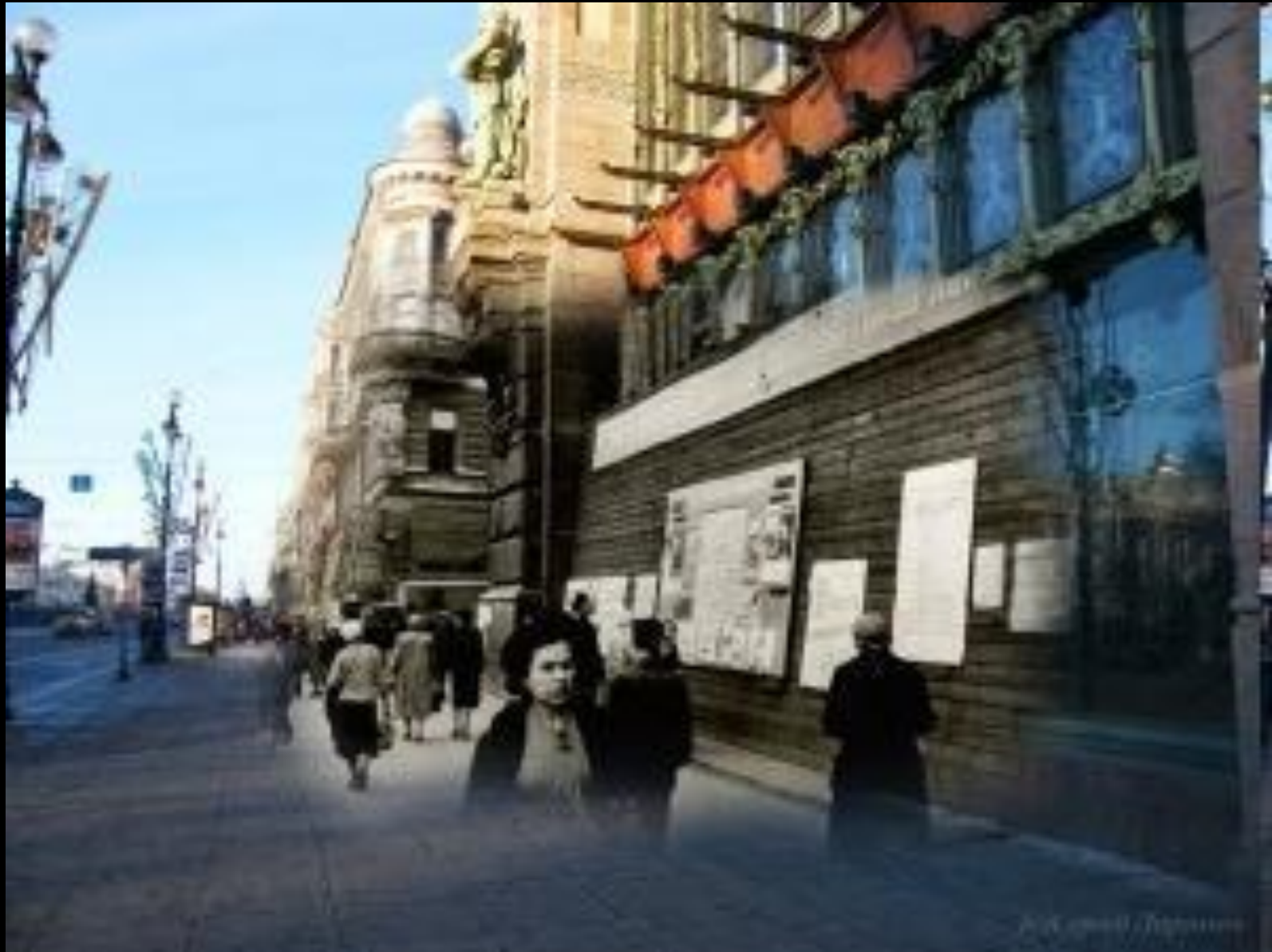
Jack Cornwell Collection