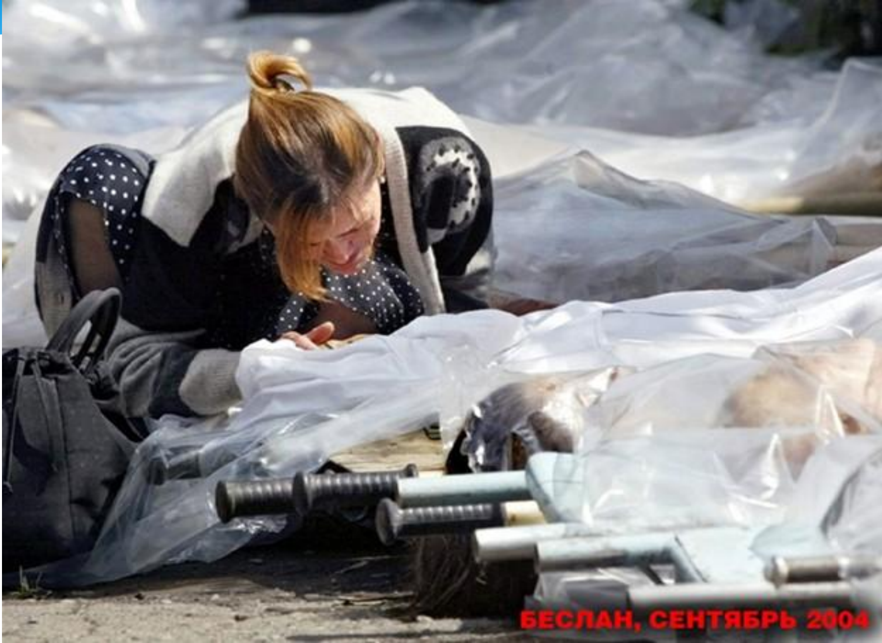
БЕСЛАН, СЕНТЯБРЬ 2004