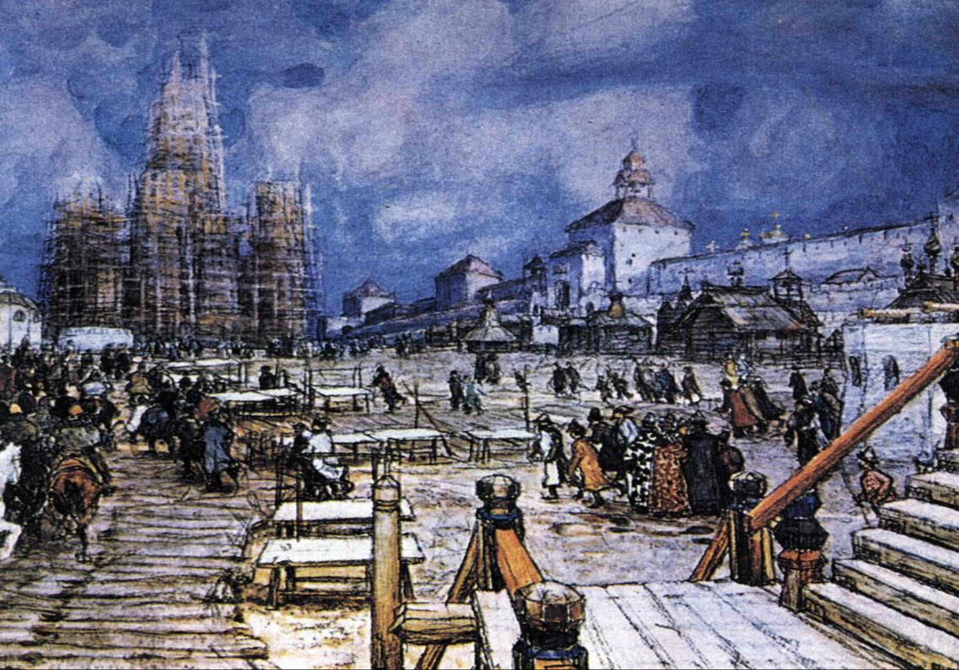
Москва времён правления Ивана Грозного. Вид на Красную площадь.