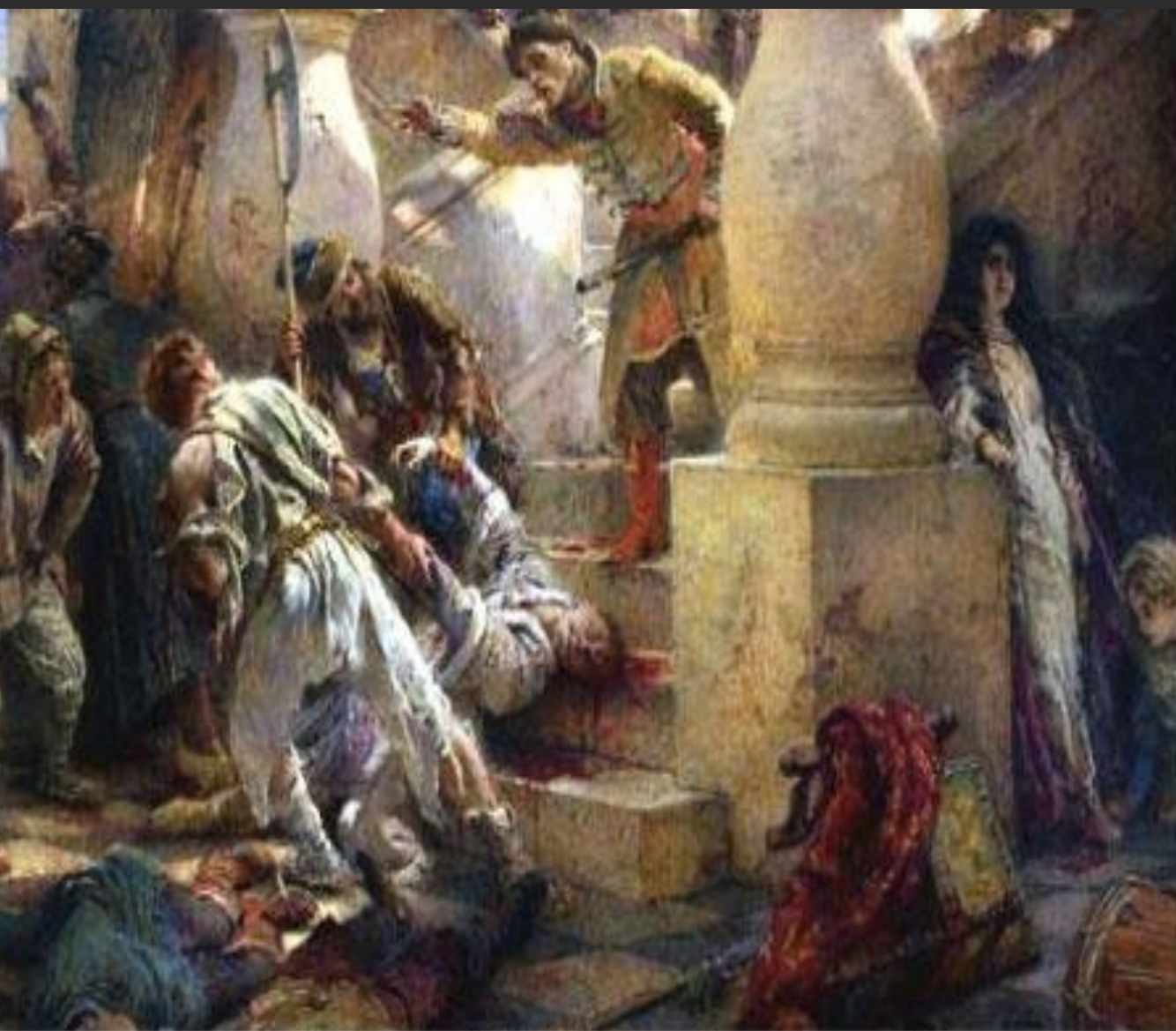
Константин Маковский "Убийство Лжедмитрия"