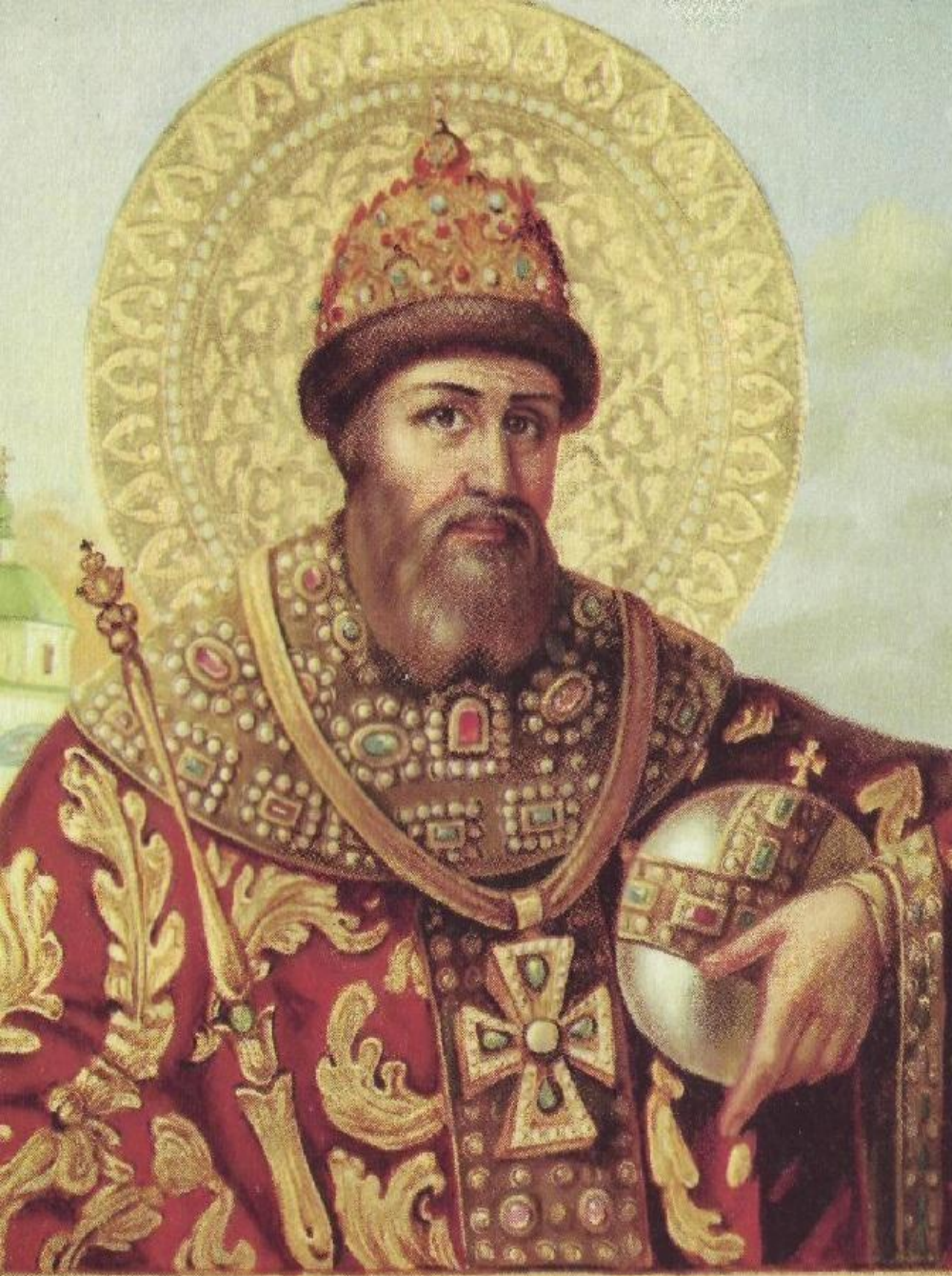
Благ. Царь Іоаннъ Грозный.