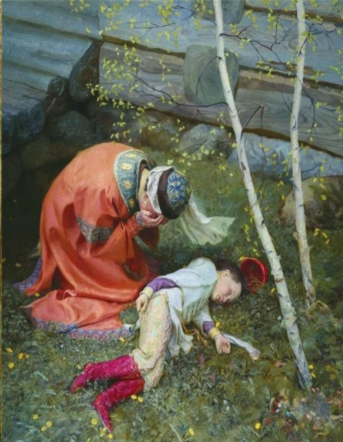
Царевич Дмитрий. Картина М.Нестерова