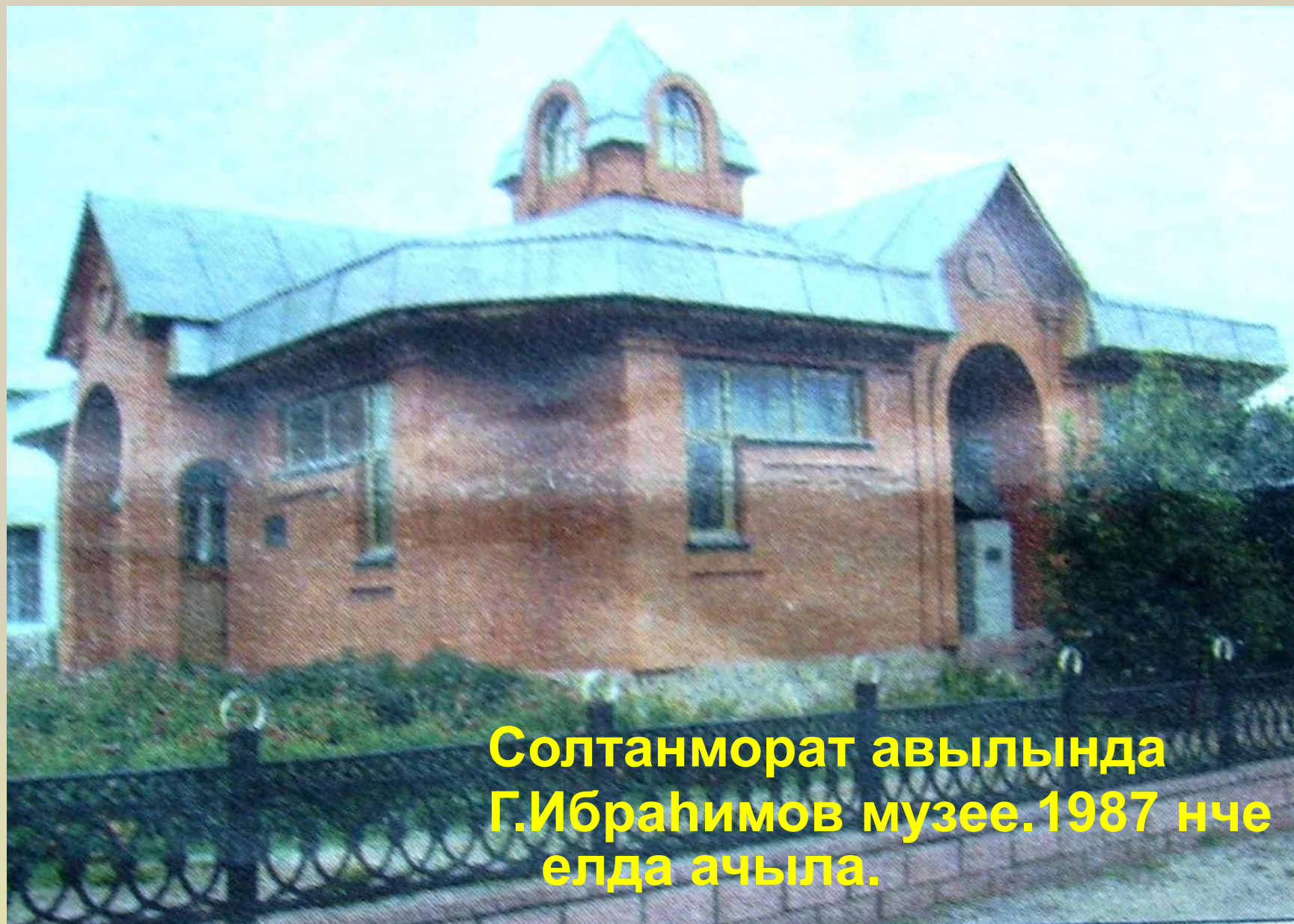
Солтанморат авылында Г.Ибраһимов музейе.1987 нче елда ачыла.