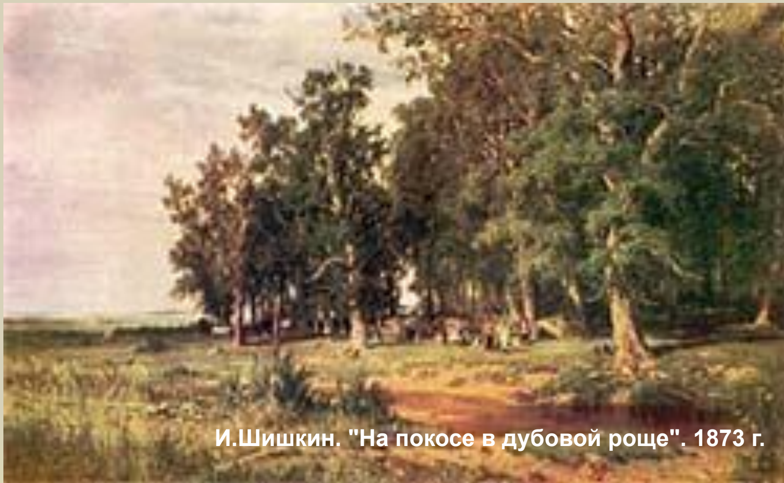
И.Шишкин. "На покосе в дубовой роще". 1873 г.

“Бу чәчәкләр, таллар өстендә нәфис һәм матур кошлар үзләренең моңнарын, шатлыклы көйләрен, сандугач үzeneң мэхәббәтен сайрый. Кая гына карама, күңел күтәрелә торган моңнар, матур күренешләр генә очрый.”