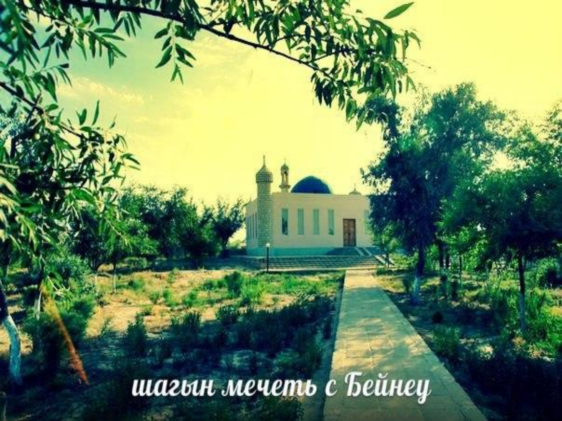
шагын мечеть с Бейнеу