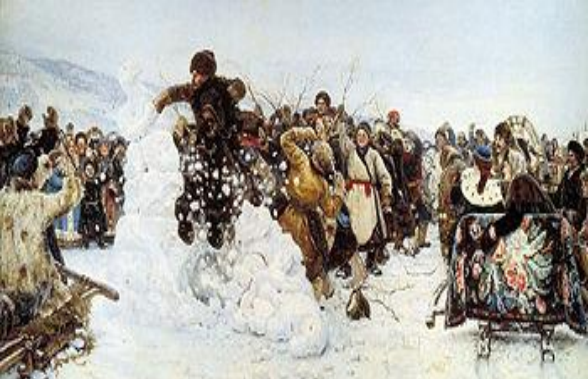
Взятие снежного города