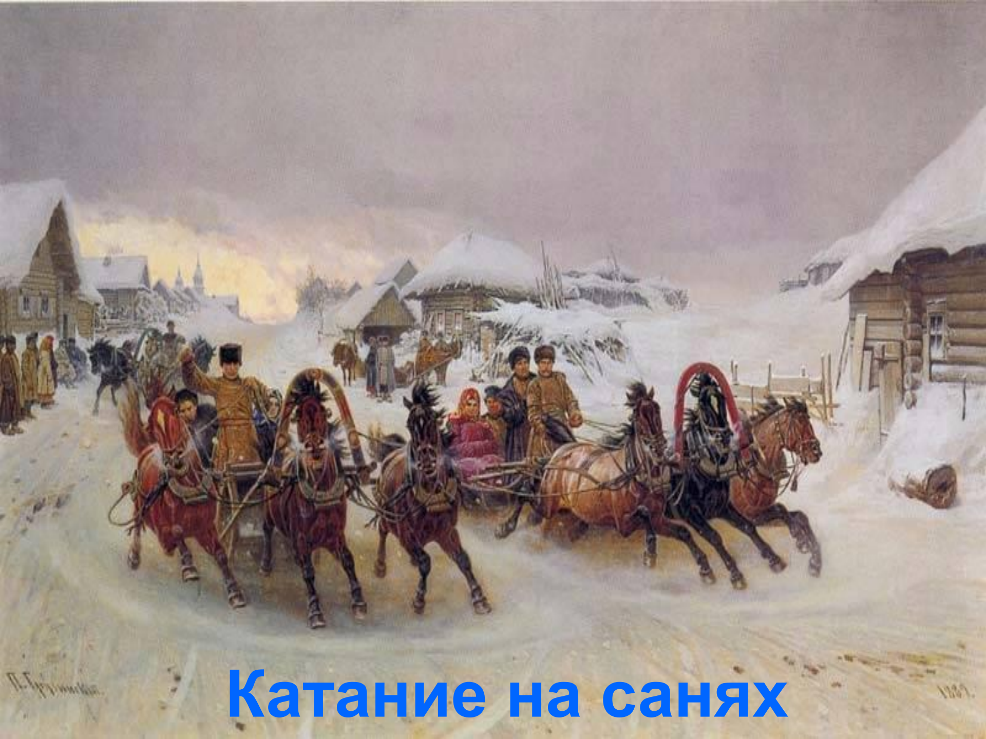
Катание на санях