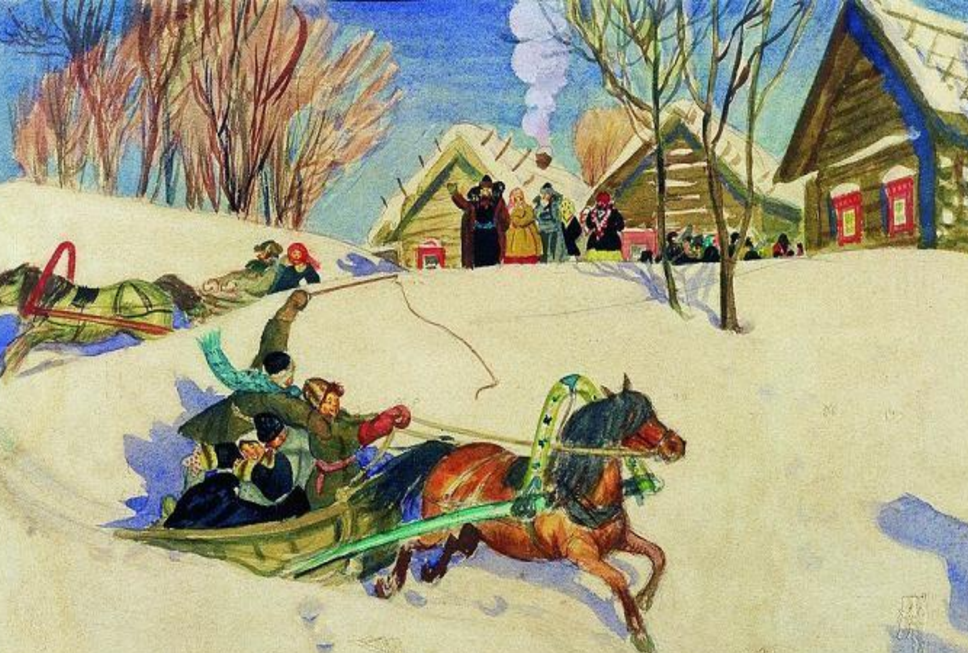
Катание на санях