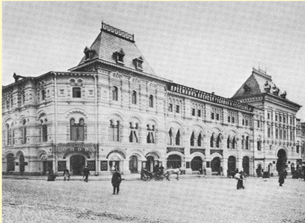
Верхние торговые ряды, конец XIX века.