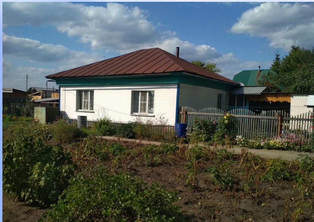
Дома на улице Куйбышева