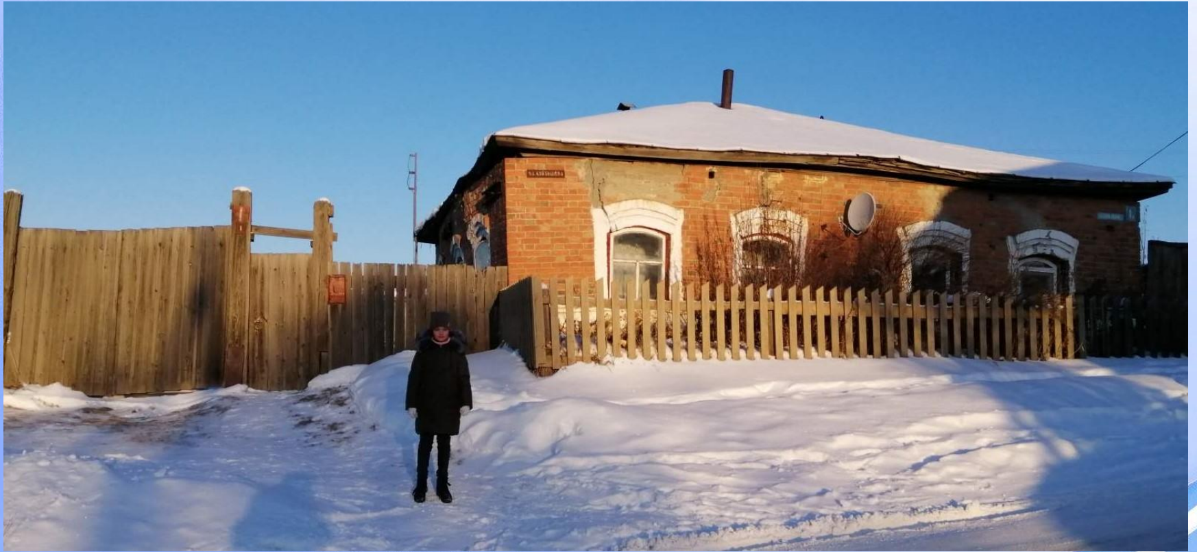
Кирпичный дом, с которого начинается улица Куйбышева (под №1)