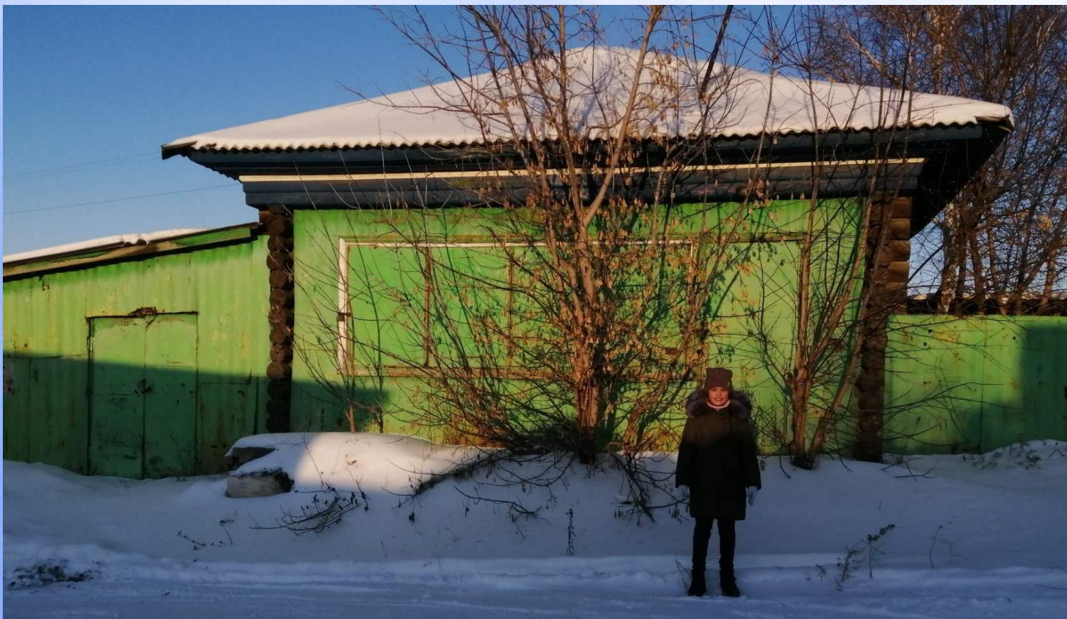
Магазин «Осиновский», построенный в 50-х годах XX века