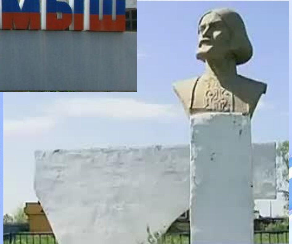
Памятник Антону Лоскутникову