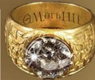
ЙӨЗЕК ( ПЕРСТЕНЬ)