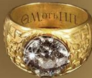
ЙӨЗЕК ( ПЕРСТЕНЬ)