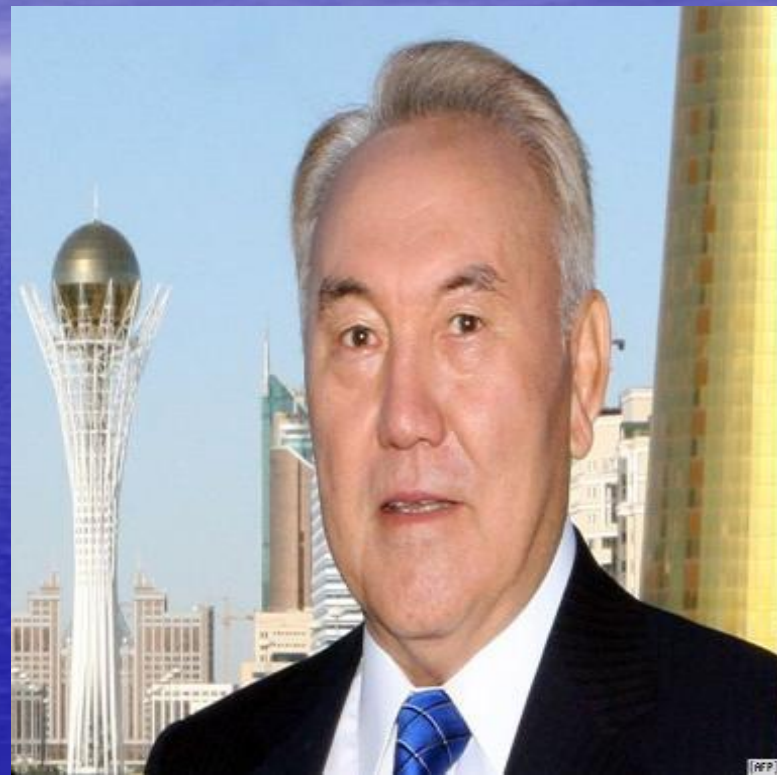
Из послания президента Республики Казахстан Н.А.Назарбаева