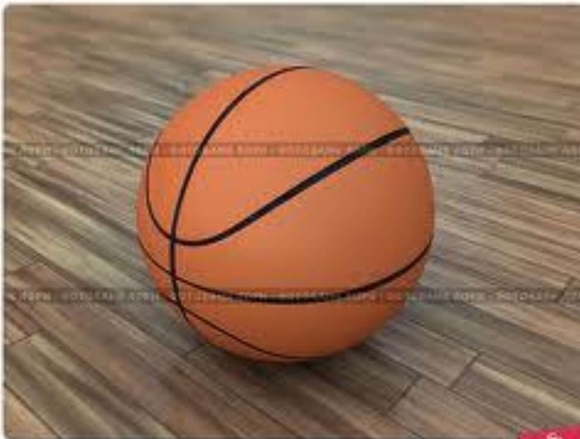
Баскетбольный мяч на полу