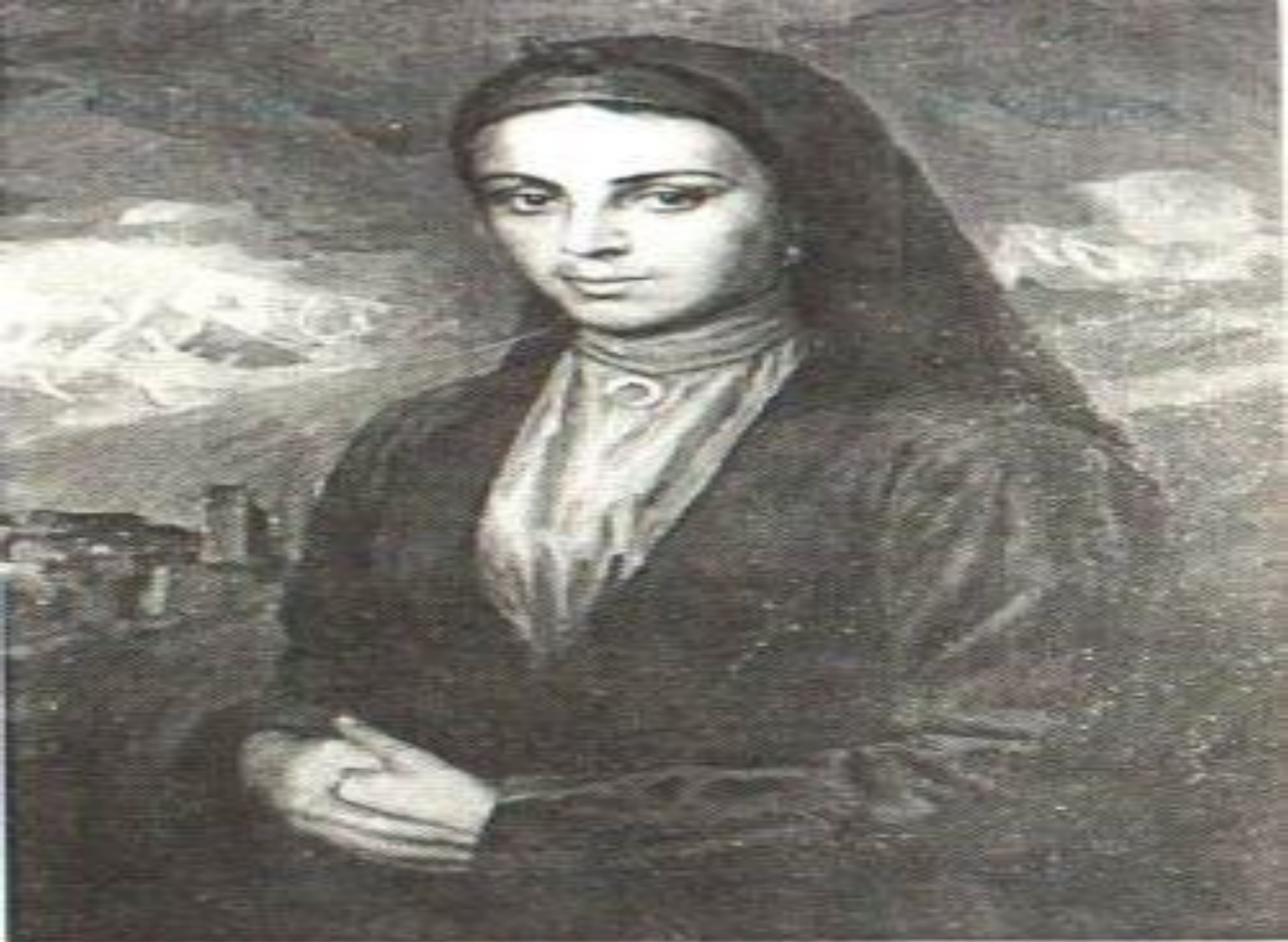
Мадонна Габриелла Габриелла - мать Христа