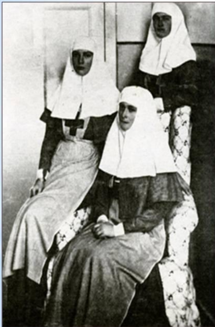
Сестры милосердия Императрица Александра Федоровна (в кресле) со старшими дочерьми великими княжнами Татьяной и Ольгой (стоит).