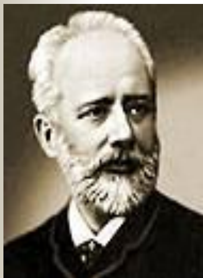
Петр Ильич Чайковский