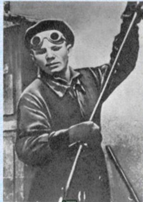
Юрий Гагарин, ученик литейщика Люберецкого завода сельскохозяйственных машин

30 сентября 1949 года Юрий Гагарин поступил учиться в Люберецкое ремесленное училище № 10. Одновременно поступил в вечернюю школу рабочей молодёжи, седьмой класс которой окончил в мае 1951 года, а в июне окончил с отличием училище по специальности формовщик-литейщик.