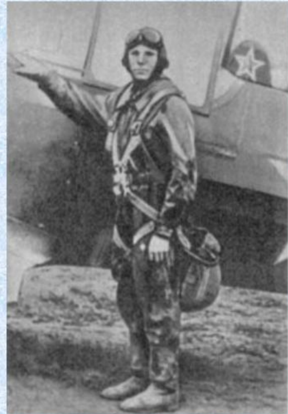
Курсант Саратовского аэроклуба Юрий Гагарин к полету готов