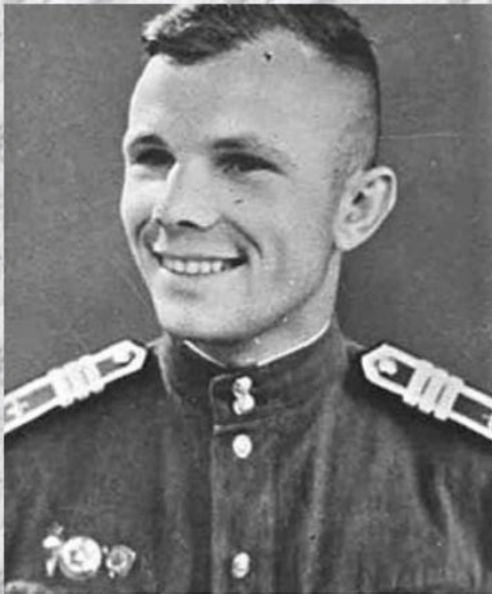
Юрий Гагарин - курсант авиационного училища - в военной форме