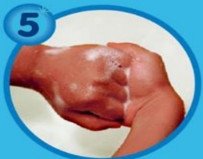
5 Моем пальчики с внешней стороны