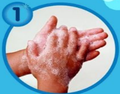
1 Ладонка об ладонку