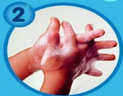
2 Между пальчиков