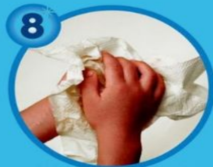
8 Смываем мыло, вытираемся насухо!