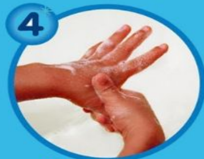
4 Моем пальчики