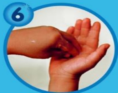
6 Не забываем про ногти