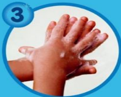
3 Тыльные стороны ладоней