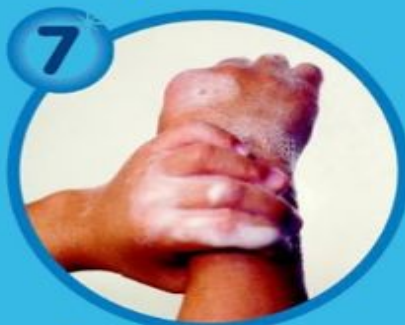
7 Моем запястья