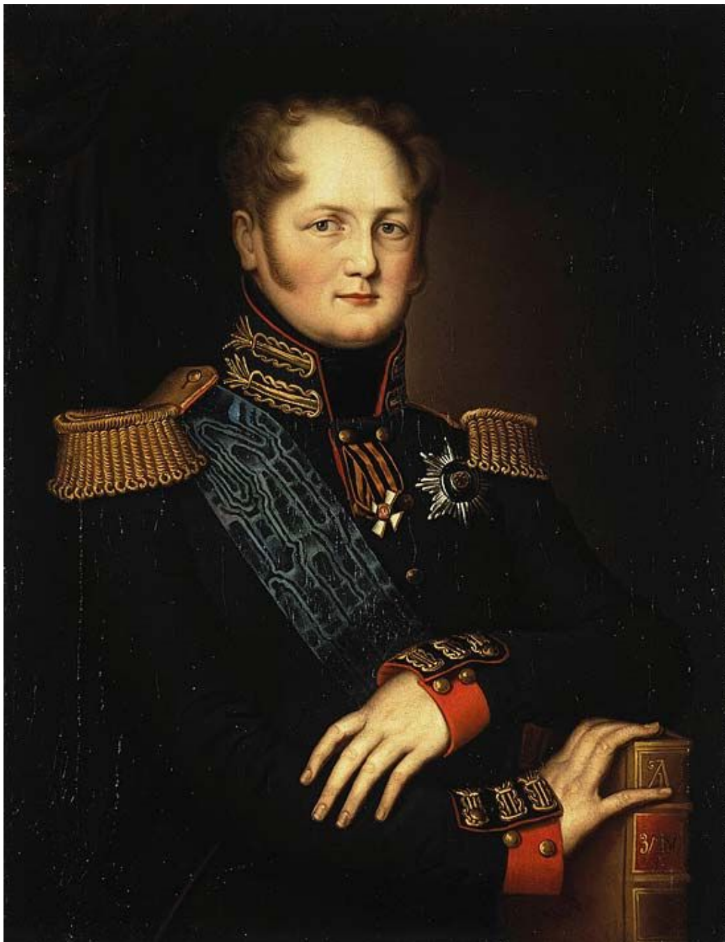
Император Александр II