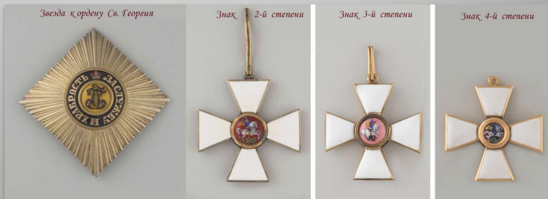
Звезда к ордену Св. Георгия