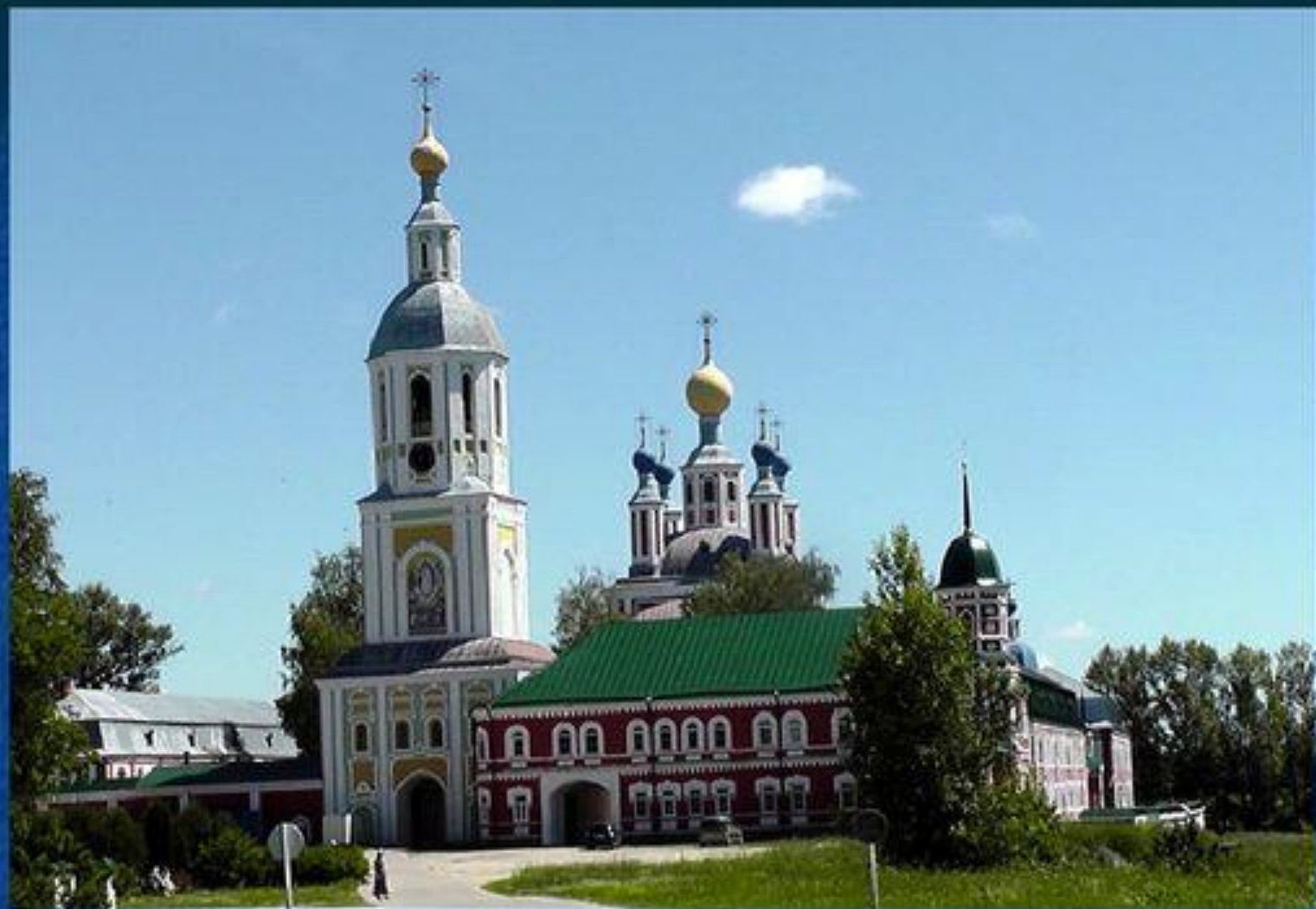
Рождество — Богородичный Санаксарский монастырь