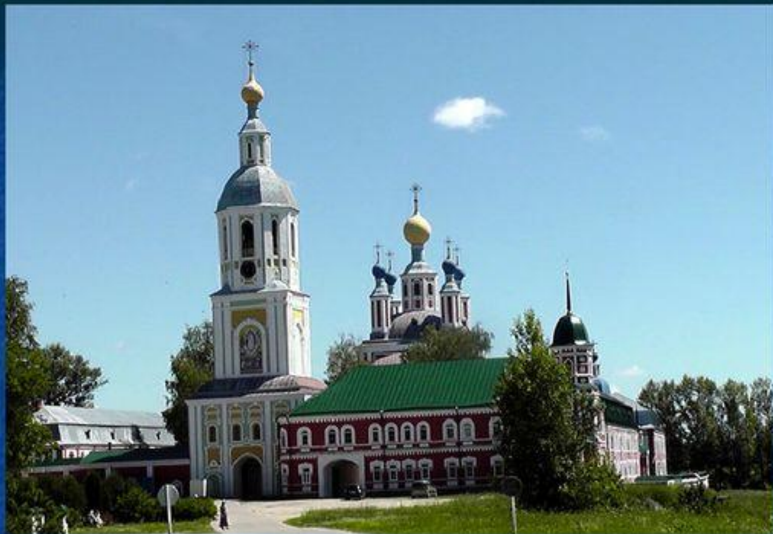
Рождество — Богородичный Санаксарский монастырь