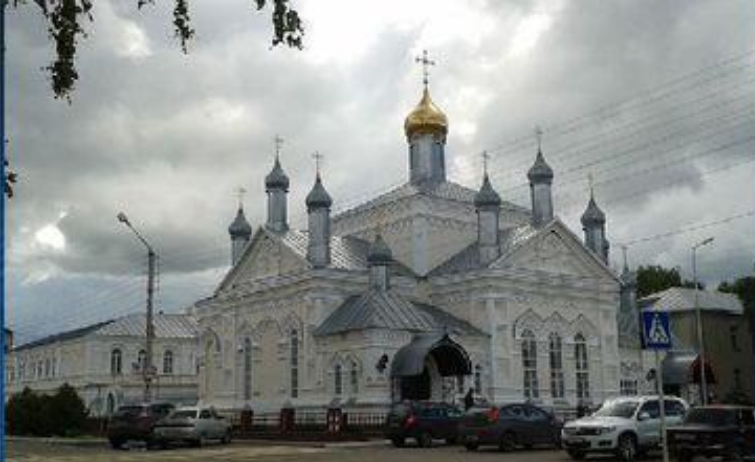
Свято-Ольгинский женский монастырь