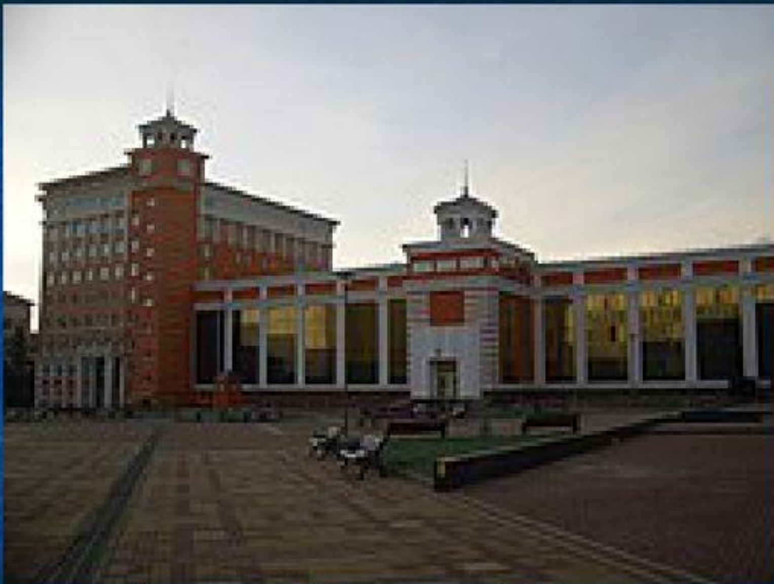
Национальная библиотека им. А. С. Пушкина