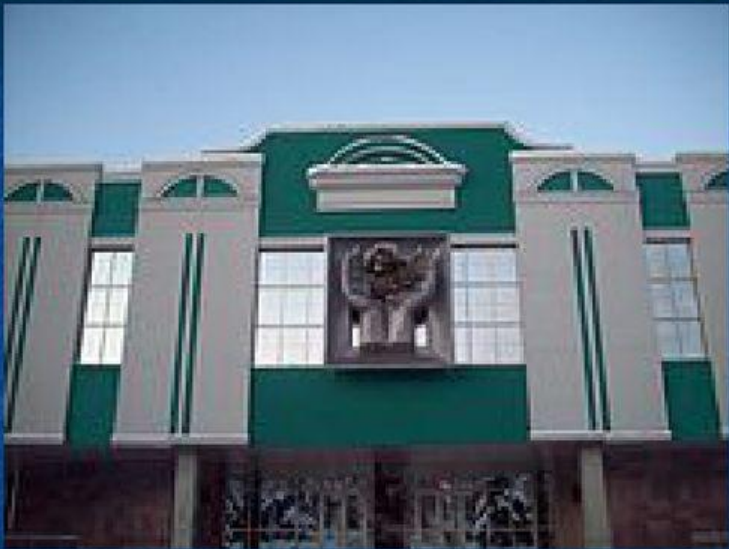
Мордовский республиканский музей изобразительных искусств им. С. Д. Эрьзи