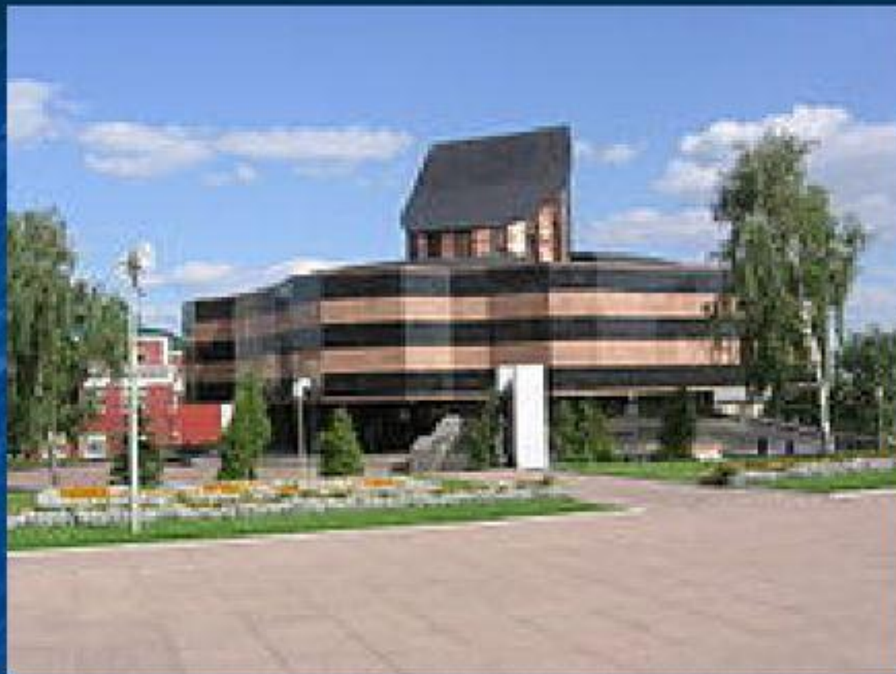
Музей боевого и трудового подвига