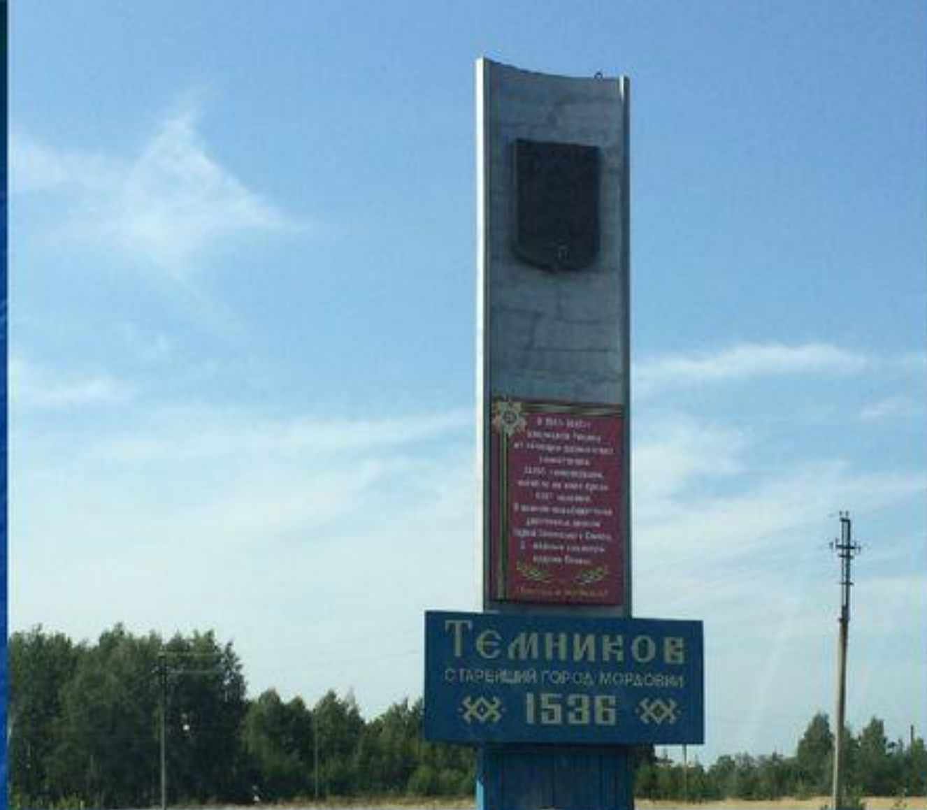
Темников (осн. в XIV в.). Основан в 1536 году Первое упоминание XII век