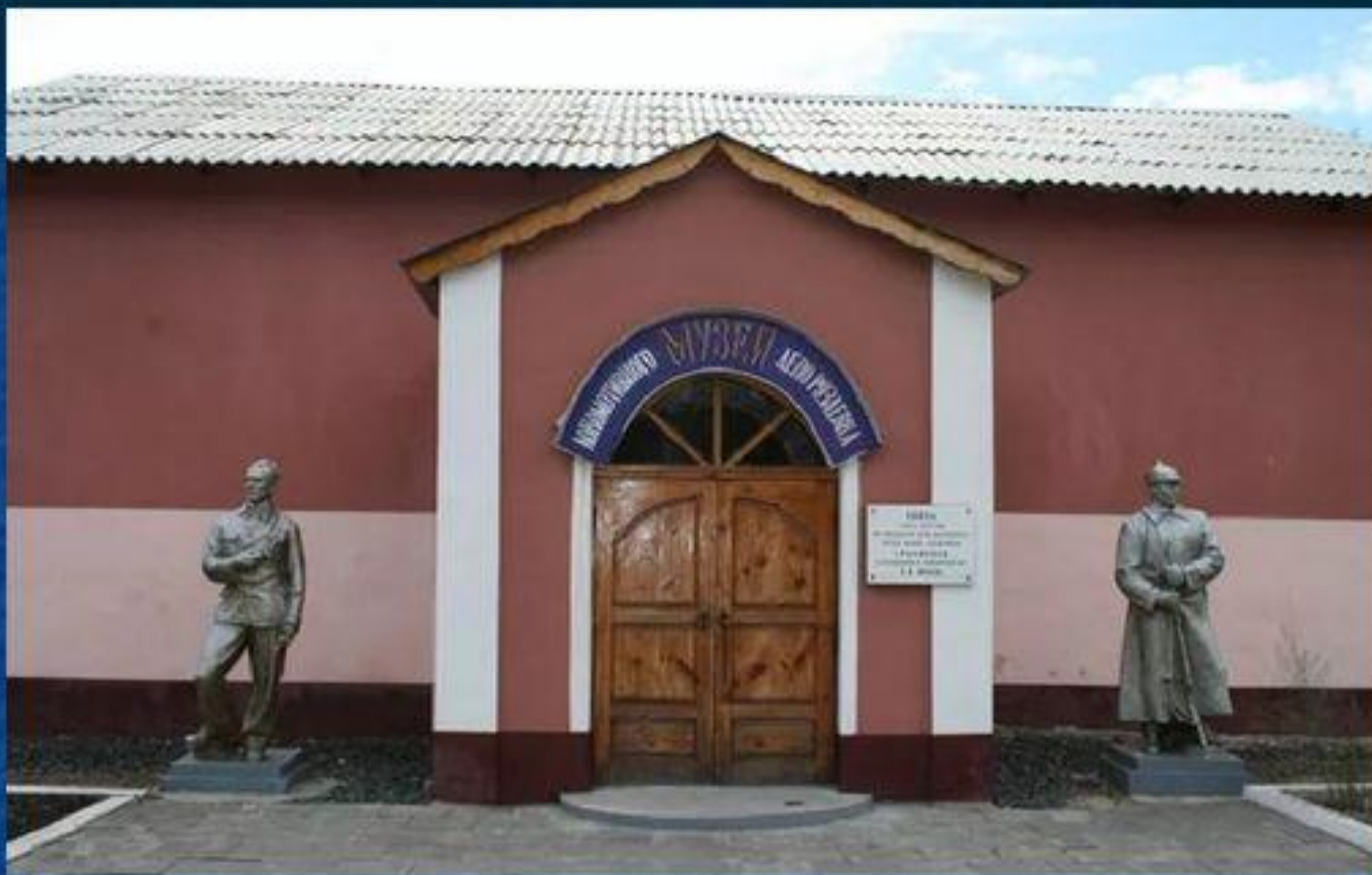
Музей локомотивного депо