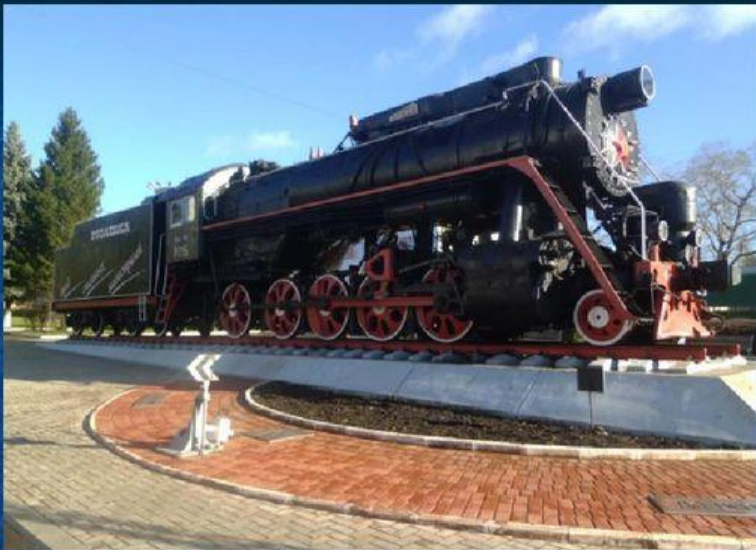
Паровоз-памятник Л-2345 «Лебедянка»