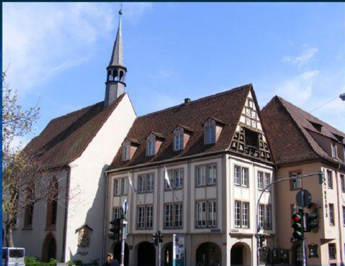
Село «Старый город»