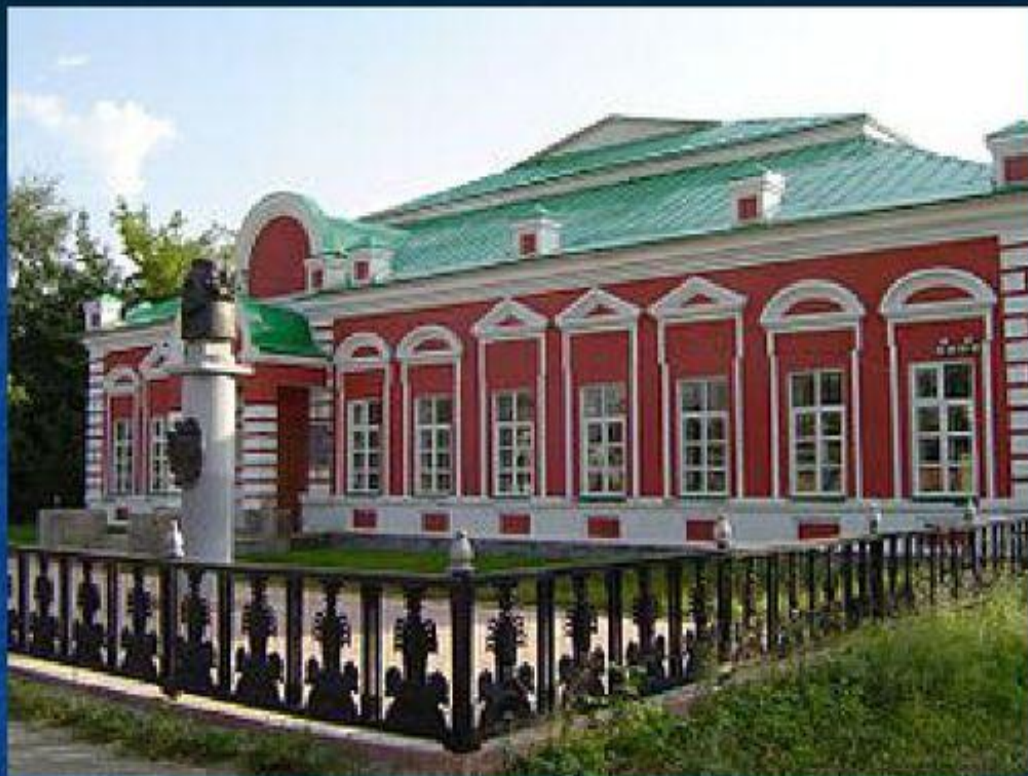
Темниковский историко-краеведческий музей имени Ф. Ф. Ушакова