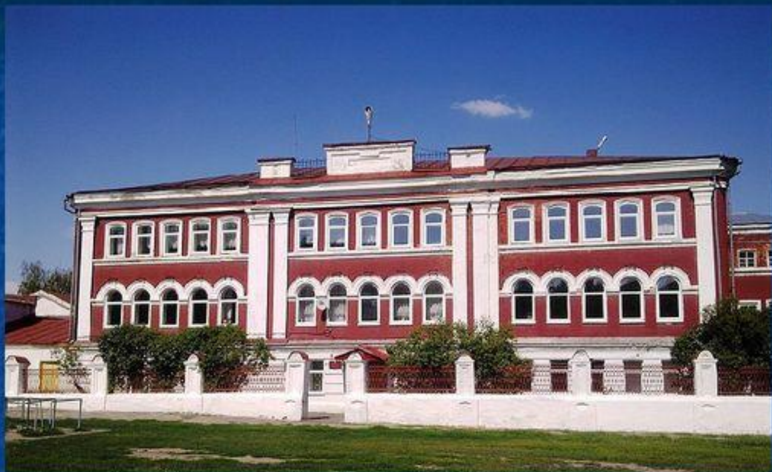
Мужское духовное училище. Парадный корпус. После революции - средняя школа.