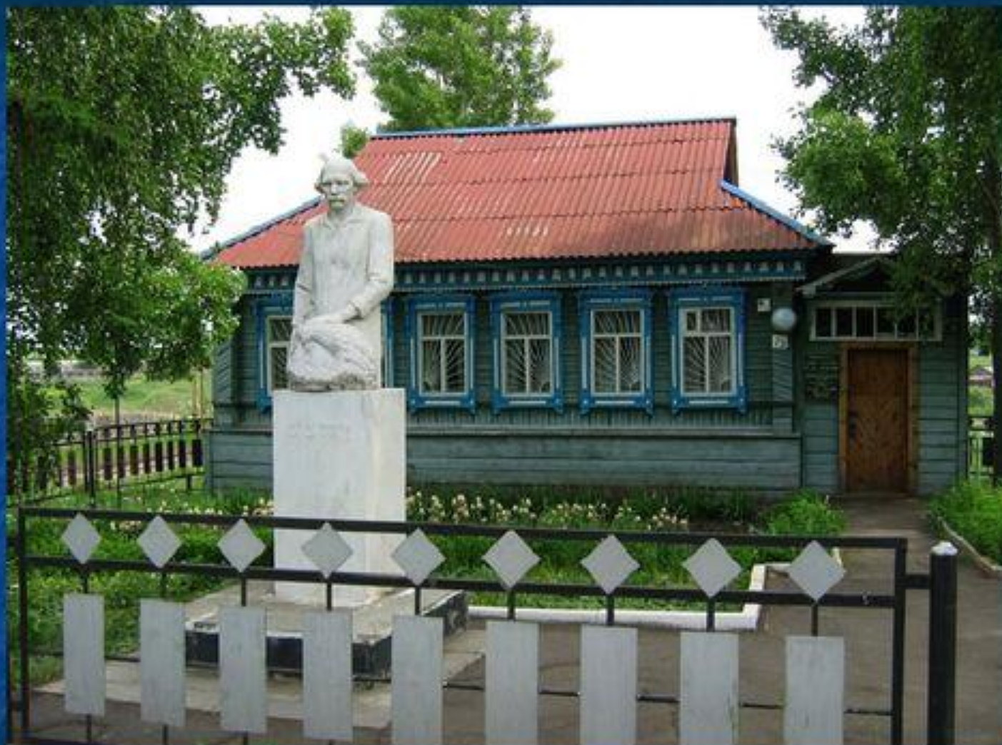
Дом-музей имени Эрьзи