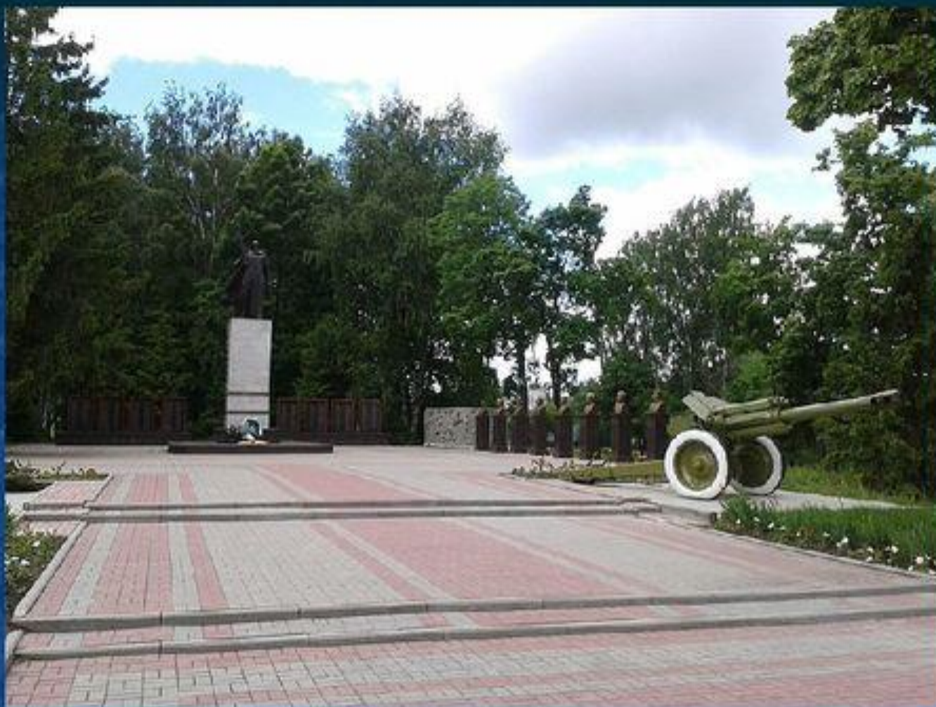
Мемориал павшим в годы Великой Отечественной войны и аллея Героев