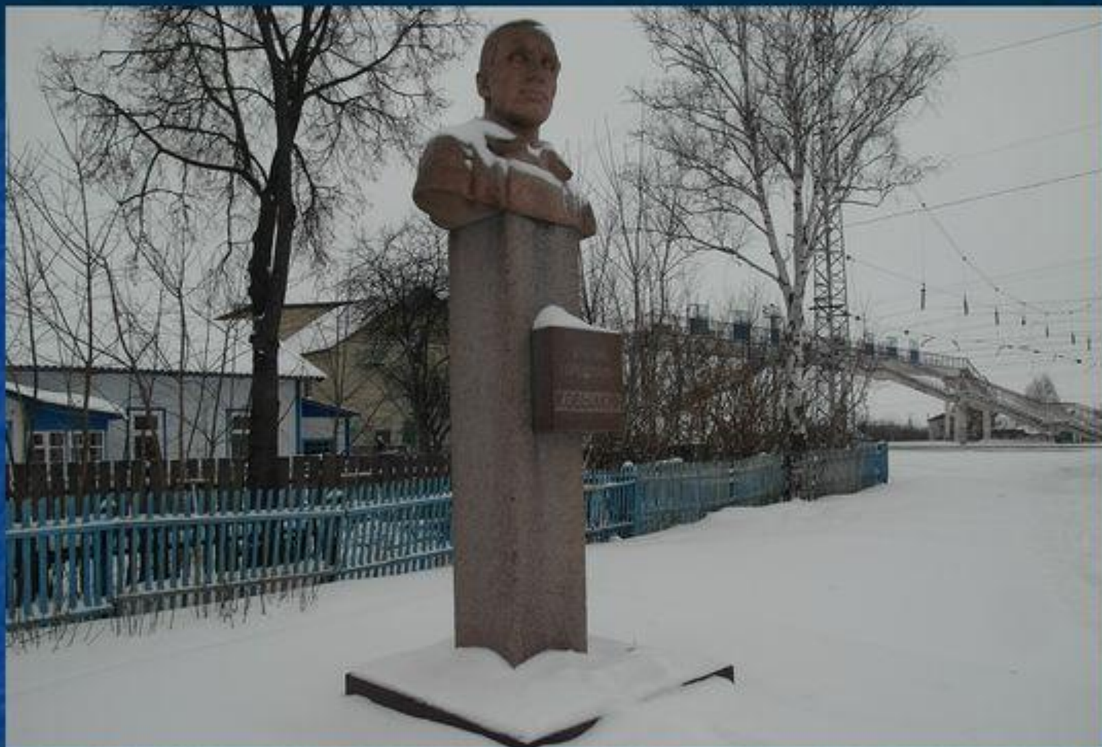
Памятник в честь комиссара железных дорог Степана Терентьевича Ковылкина.