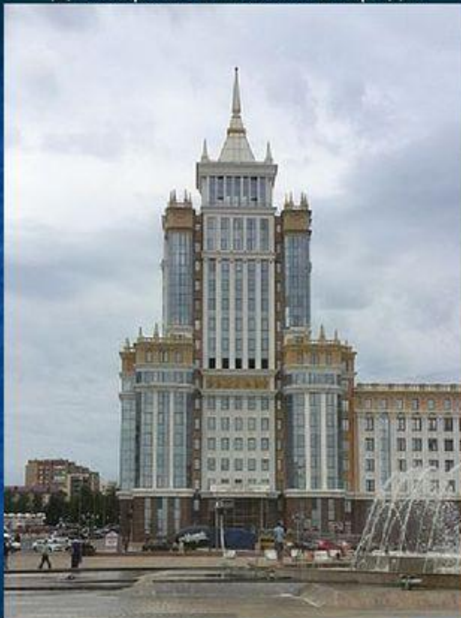
Мордовский государственный университет имени Н. П. Огарёва, главный корпус