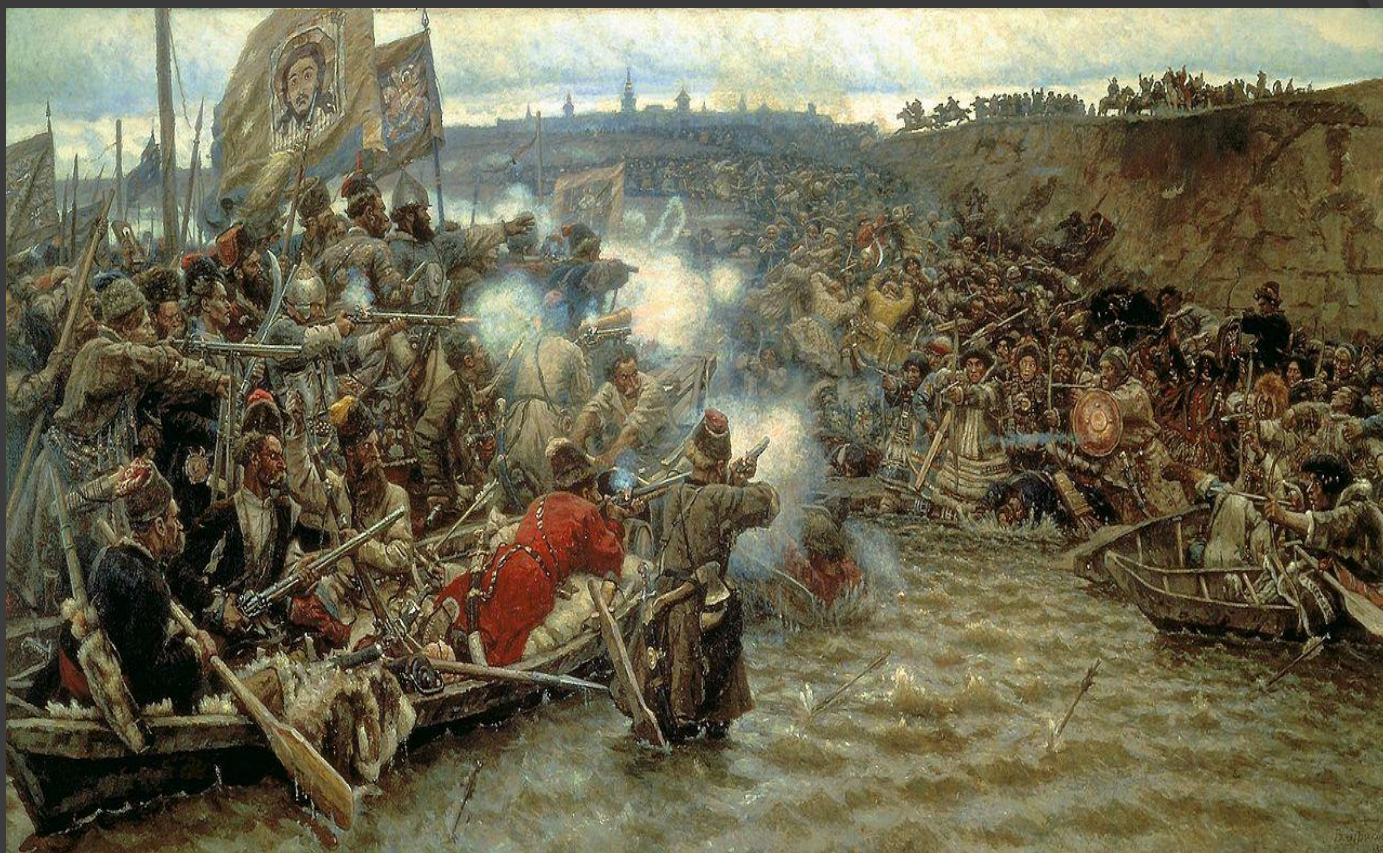
Картина Василия Ивановича Сурикова «Покорение Сибири Ермаком» (Гос. русс. музей, С-Пб,разм.3х6м, 1891-1895г., 1581-1585-покорение, 110 лет спустя)