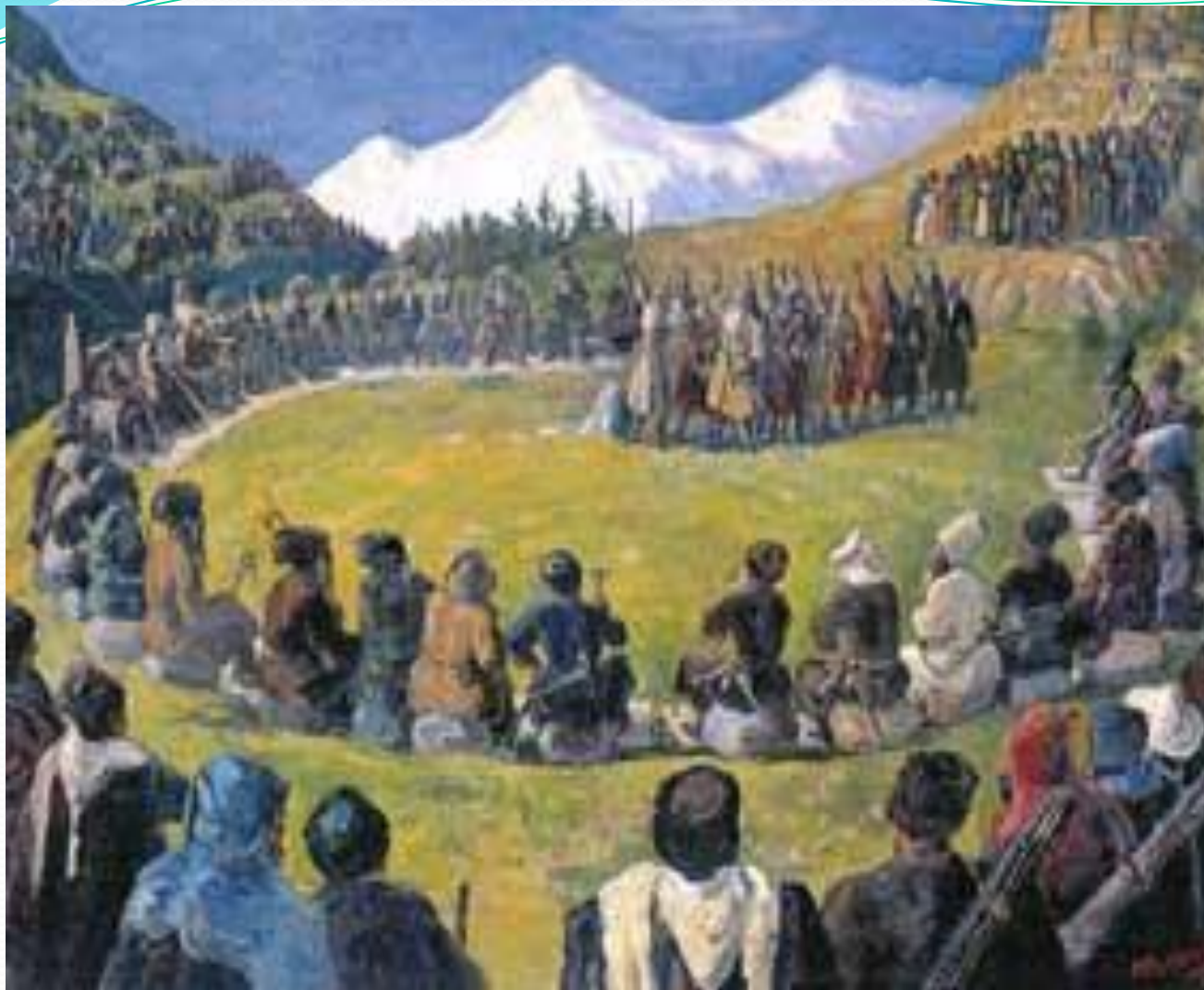
Адæм тæрхон кæнынц цы бакæной ууыл.