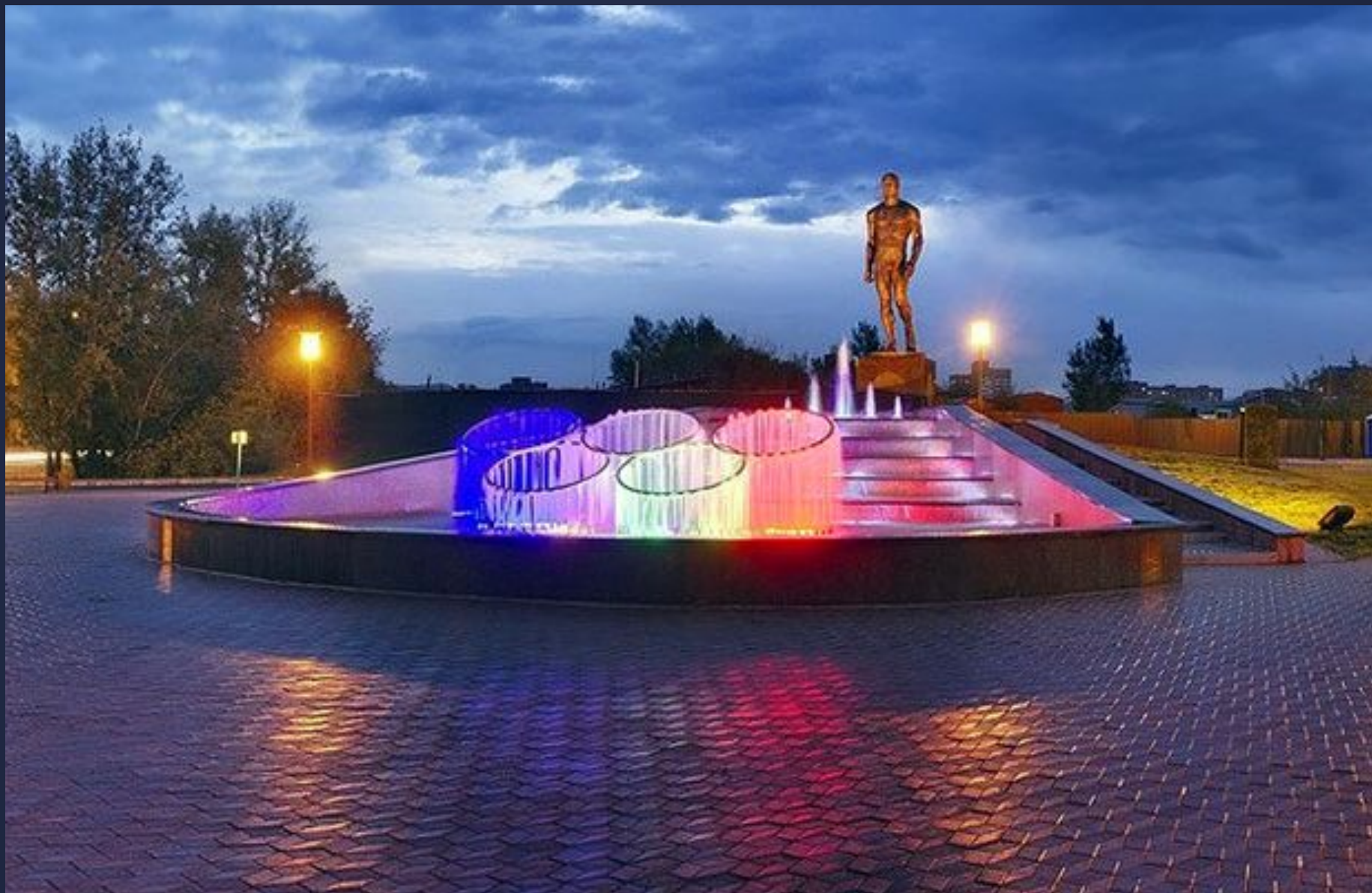
Памятник Ивану Ярыгину