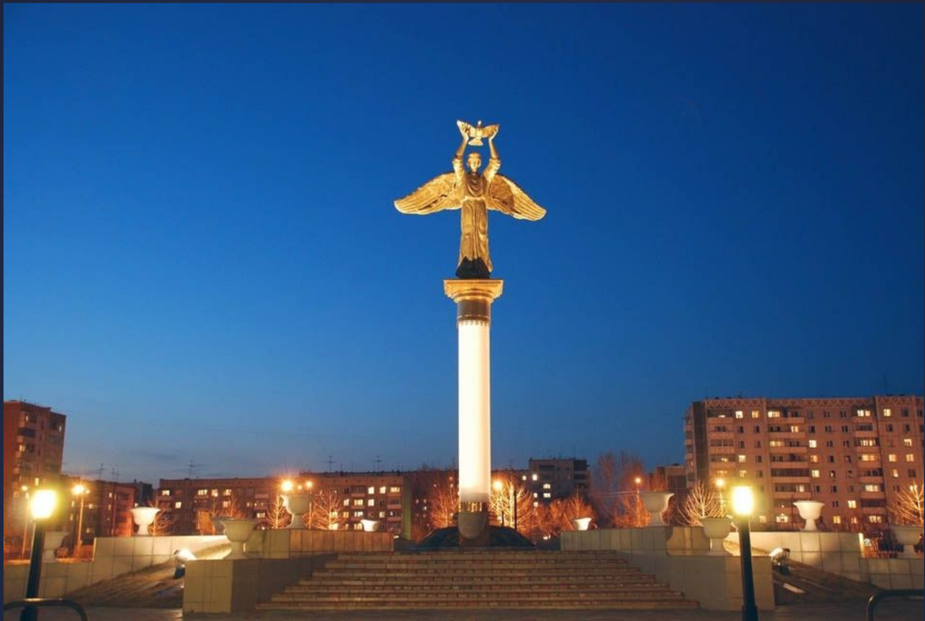
Архитектурно-парковый комплекс "Добрый Ангел Мира"