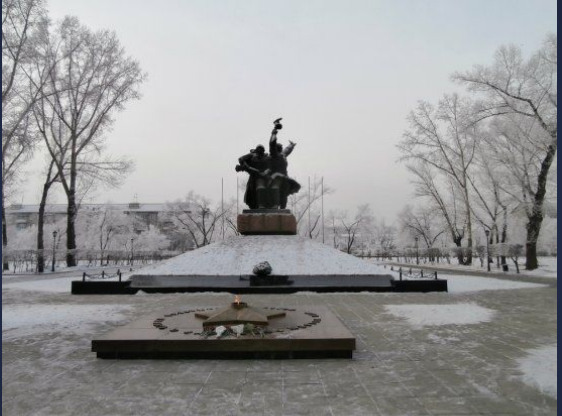
Парк Победы, мемориал Воинской славы