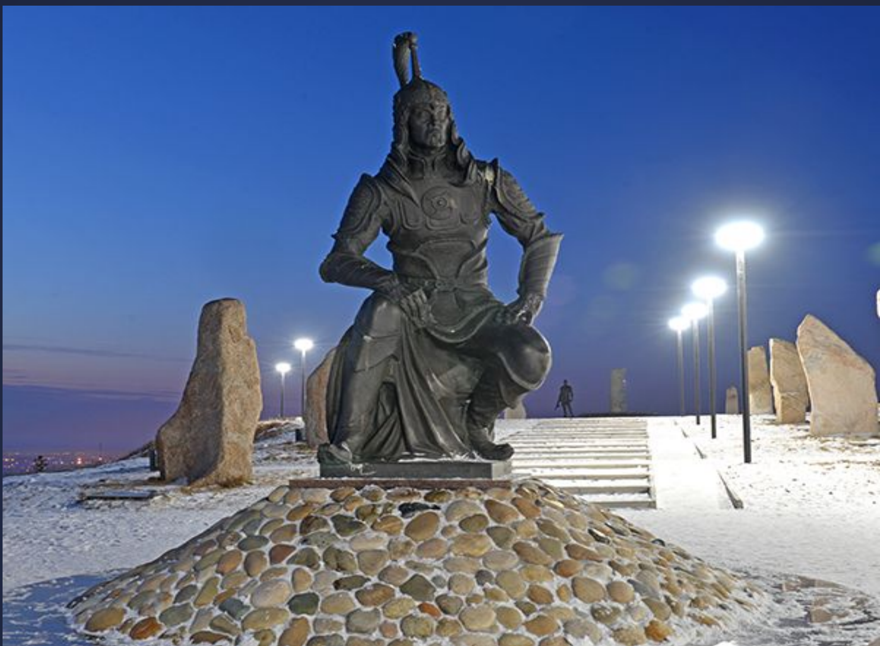
Мемориальный комплекс на г.Самохвал