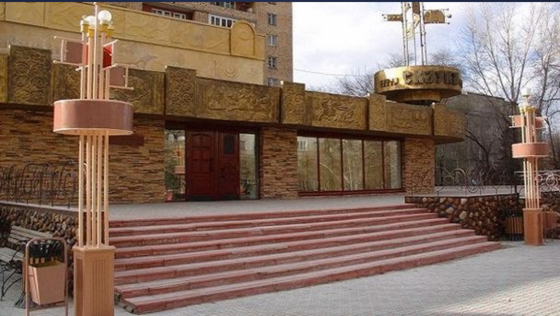
Хакасский национальный театр кукол «Сказка»