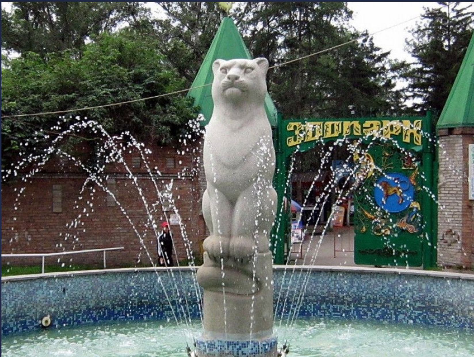
Центр живой природы, Абаканский зоопарк