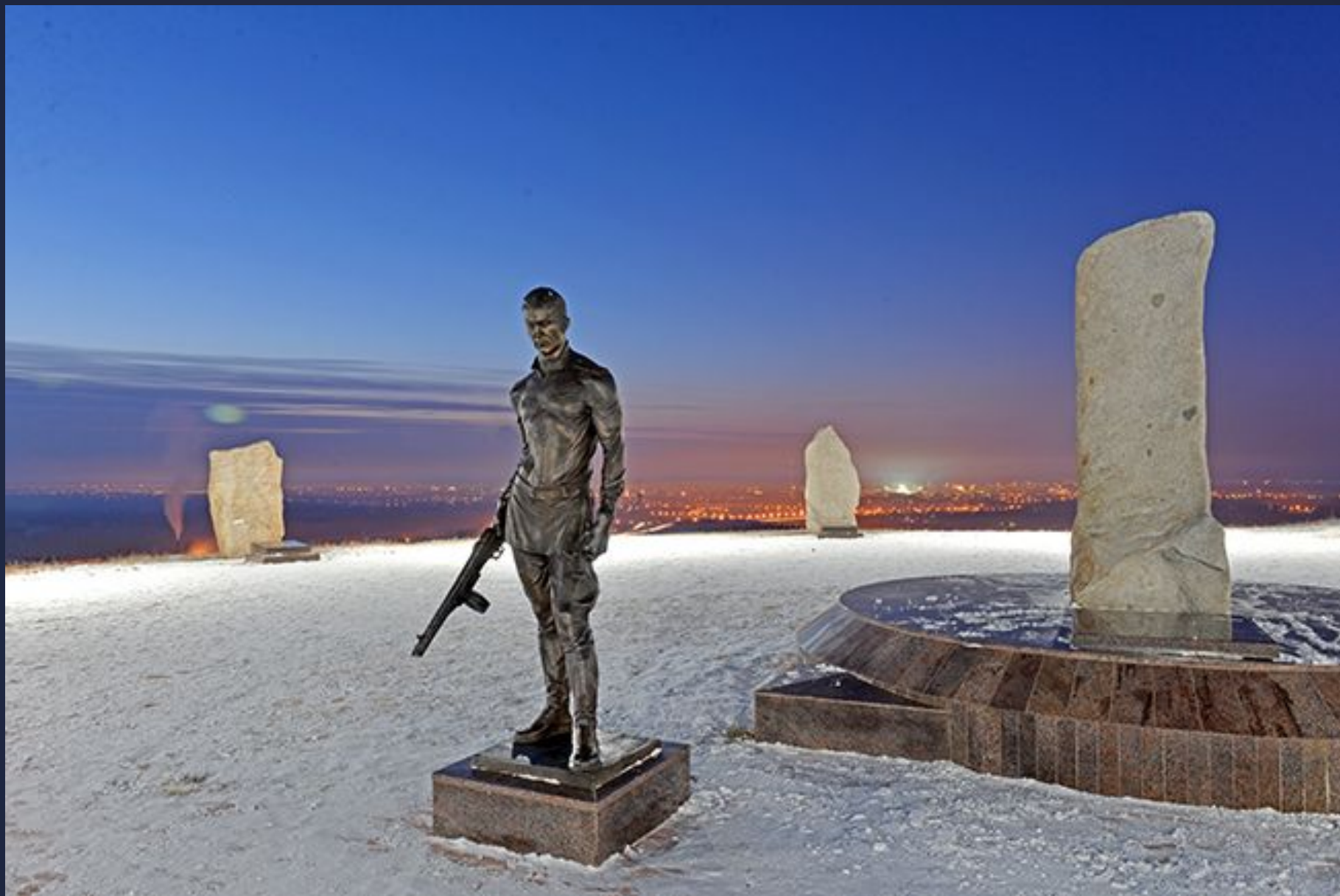
Мемориал на горе Самохвал