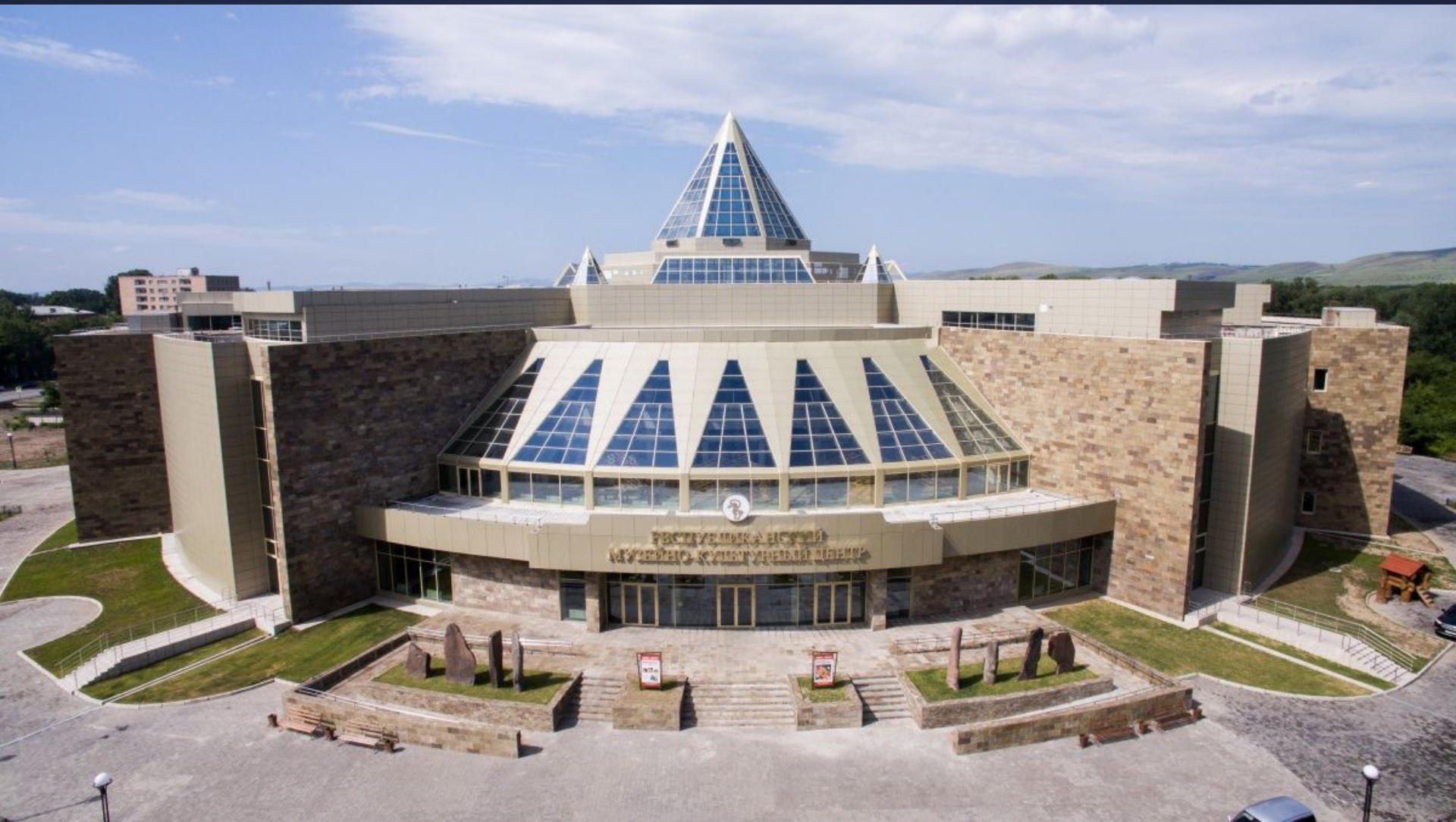
Республиканский музейно-культурный центр