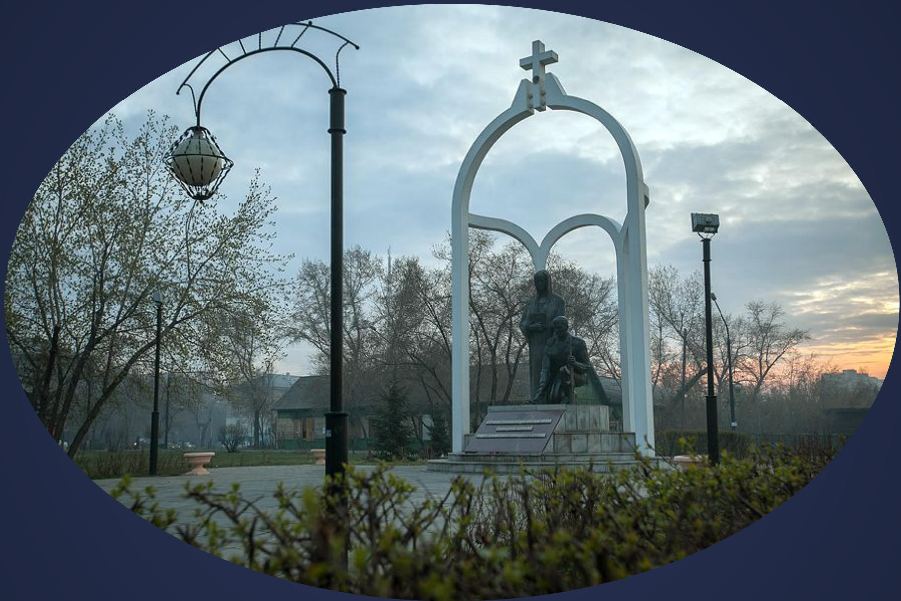
Памятник воинам, погибшим в локальных войнах