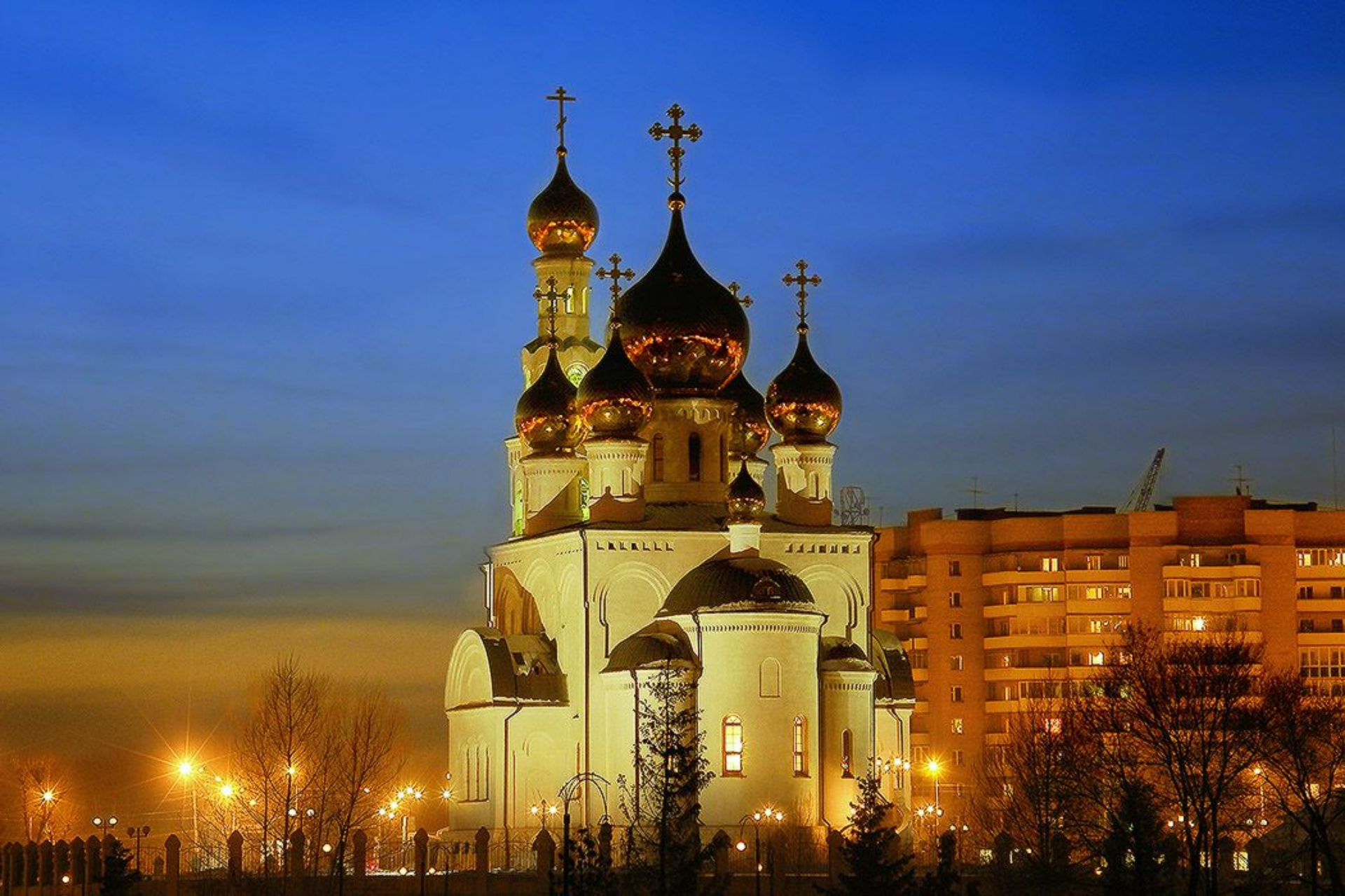
Спасо-Преображенский кафедральный собор