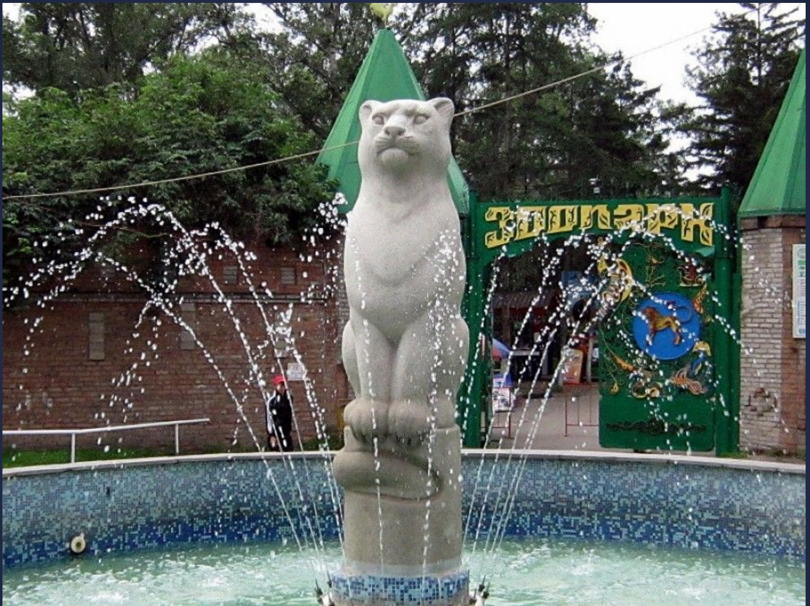
Центр живой природы, Абаканский зоопарк