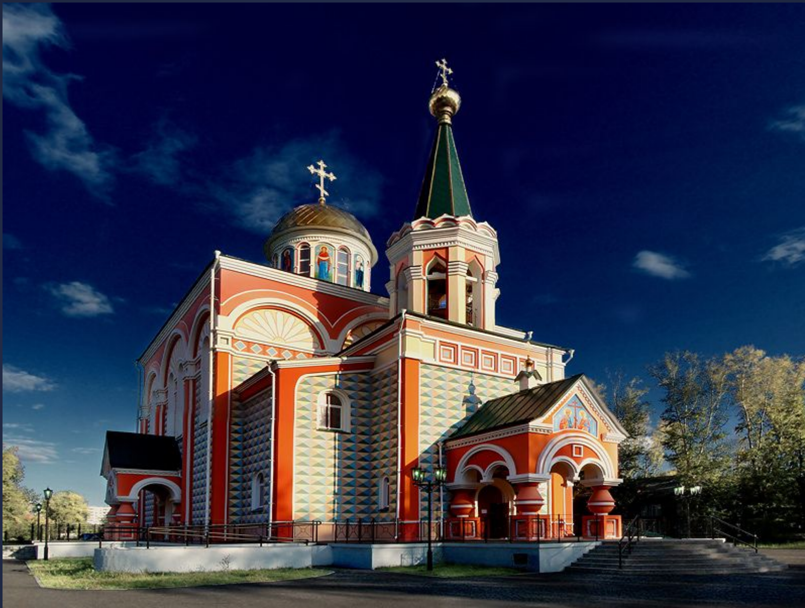
Градо-Абаканский Храм в честь Равноапостольных Константина и Елены