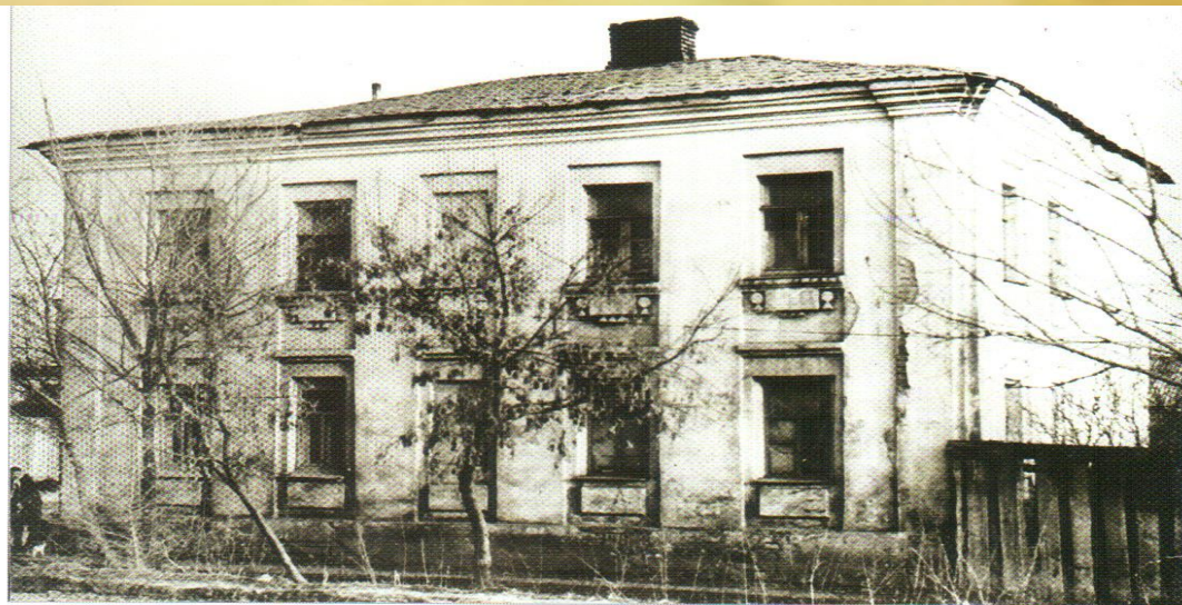
1895-1898 елларда Г.Тукай укыган өч сыңыфлы рус мәктәбе бинасы. 1960 еллардагы фоторәсем

В уральском городке молодой Тукай познакомился с творчеством великих русских поэтов - Пушкина и Лермонтова. Их стихи покорили сердце начинающего поэта.