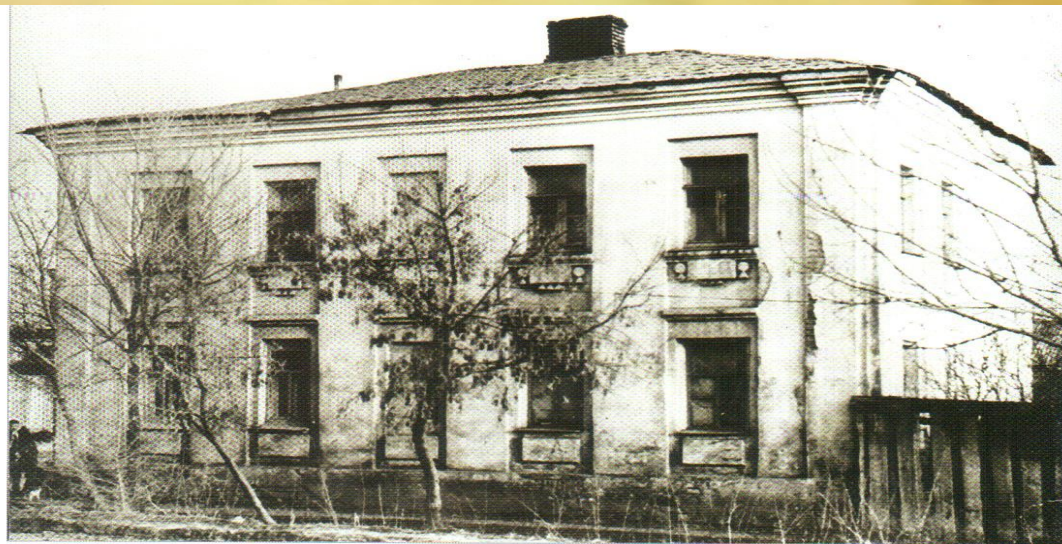
1895-1898 елларда Г.Тукай укыган өч сыныфлы рус мәктәбе бинасы. 1960 еллардагы фоторәсем

В уральском городке молодой Тукай познакомился с творчеством великих русских поэтов - Пушкина и Лермонтова. Их стихи покорили сердце начинающего поэта.