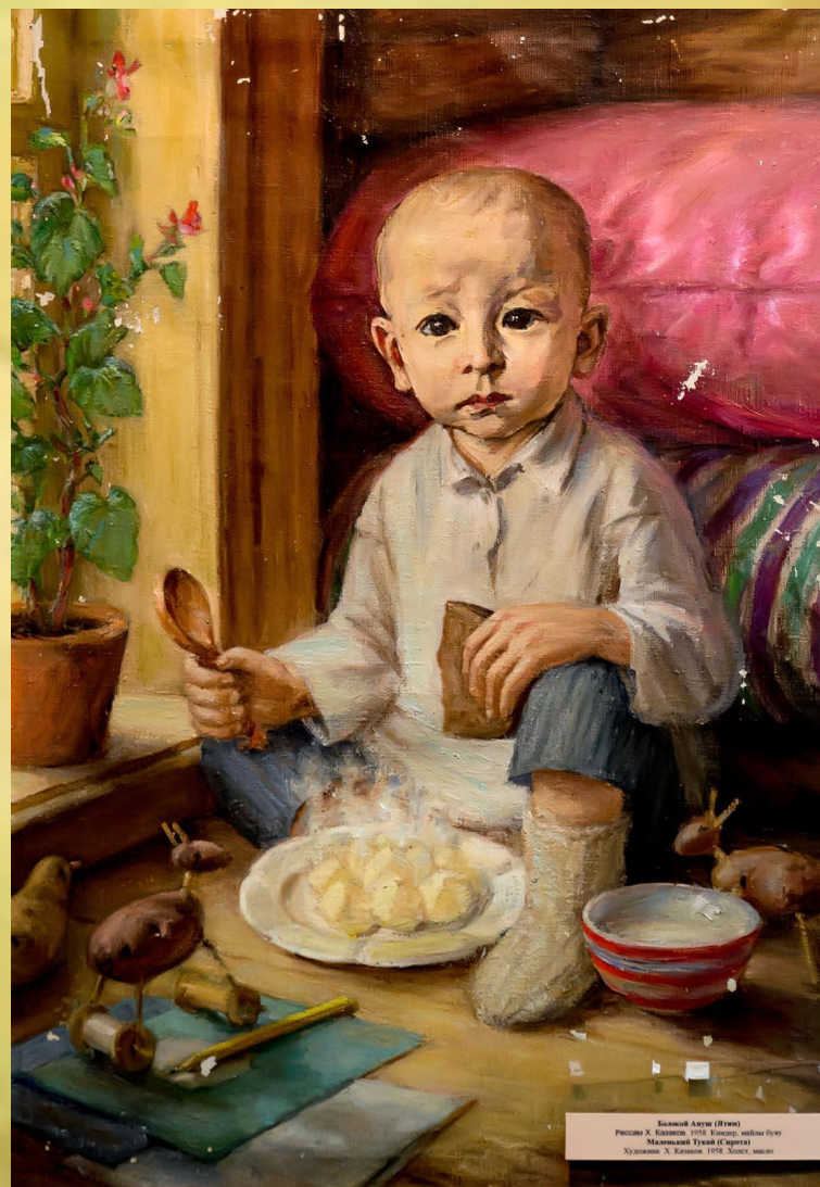
Башкир Агули (Гюль) Рисунки Х. Калашин. 1918. Казань, музей семьи Гюль Маленький Тукай (Сирота) Художник Х. Калашин. 1918. Санкт-Петербург

Родился Габдулла Тукай 26 апреля 1886 года в деревне Кушлауч Мингерской волости, бывшей Казанской губернии, ныне Арский район РТ