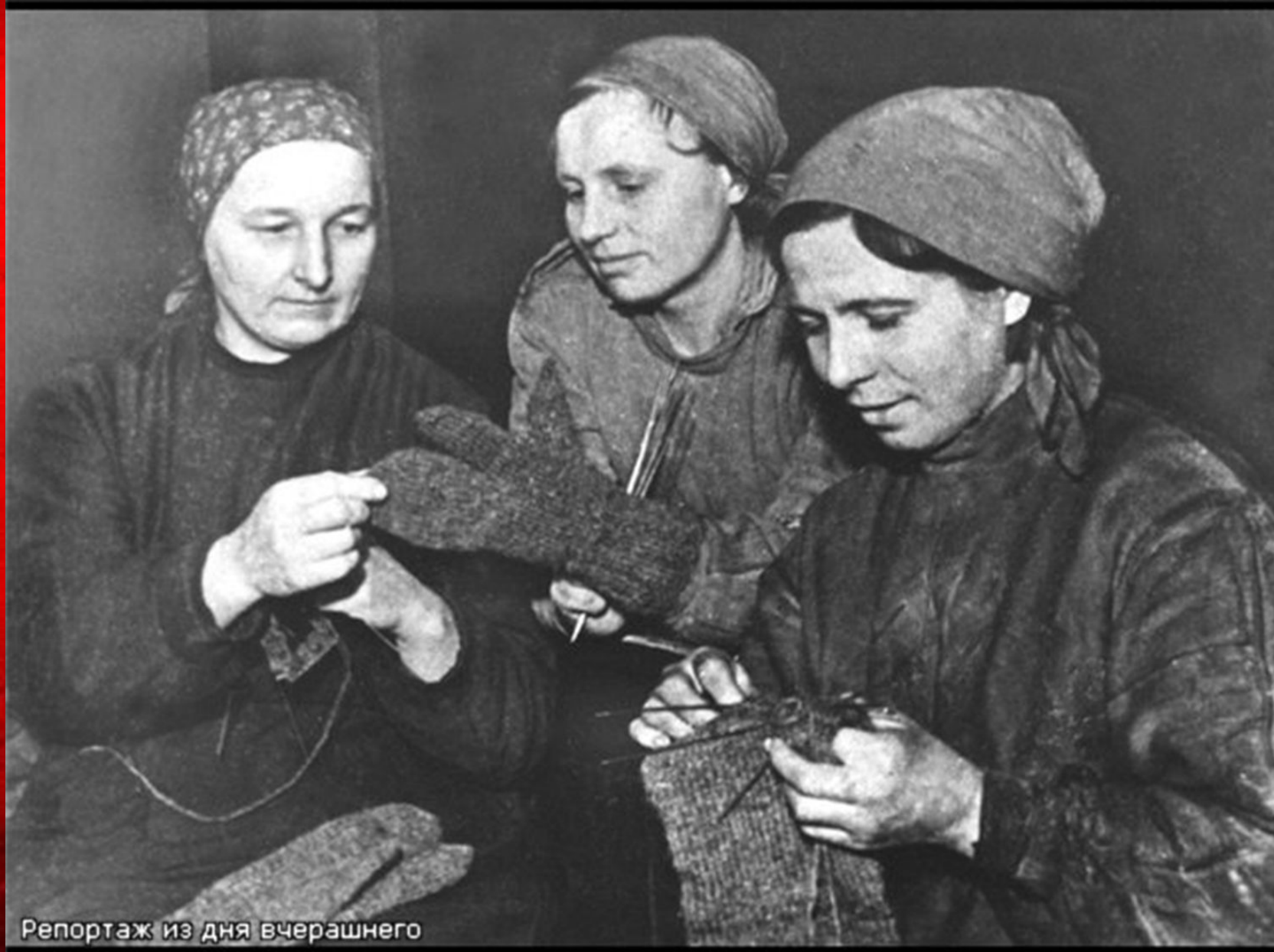
Репортаж из дня вчерашнего

В условиях крайнего обнищания жителей, когда порой одежды и обуви на всех детей в семьях не хватало, проводились селянами отдельно сборы теплых вещей (варежек, носков) для Армии. Всего к сентябрю 1943 года было собрано 200 шт. теплых вещей.