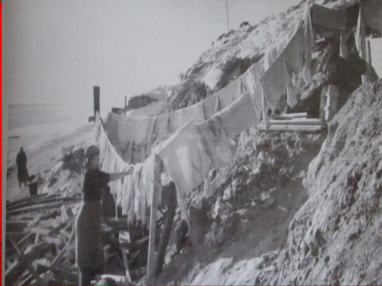
Фото – госпиталь в Сталинграде