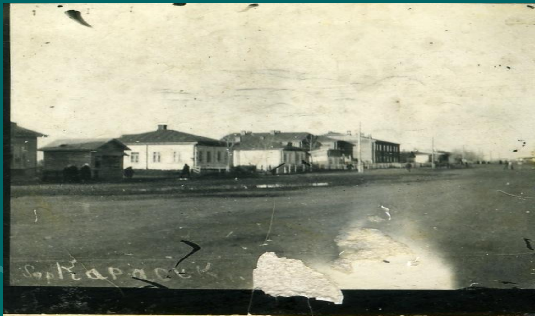
ул. Вокзальная 1926 г.