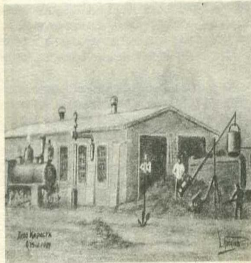
Депо станции Карасук