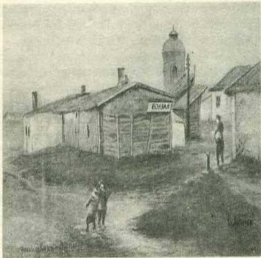
Вокзал станции Карасук