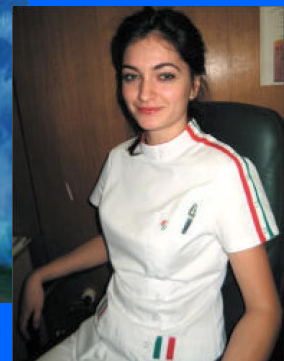
Наряд медицинского работника XXI века