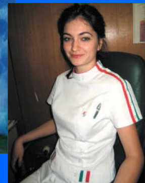
Наряд медицинского работника XXI века