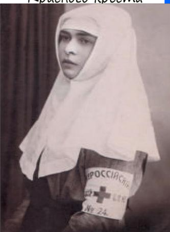
Так выглядел наряд сестры милосердия на рубеже XIX века