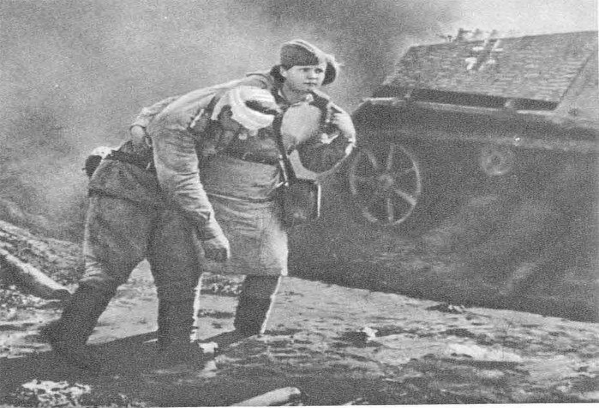
Спасая раненого воина...