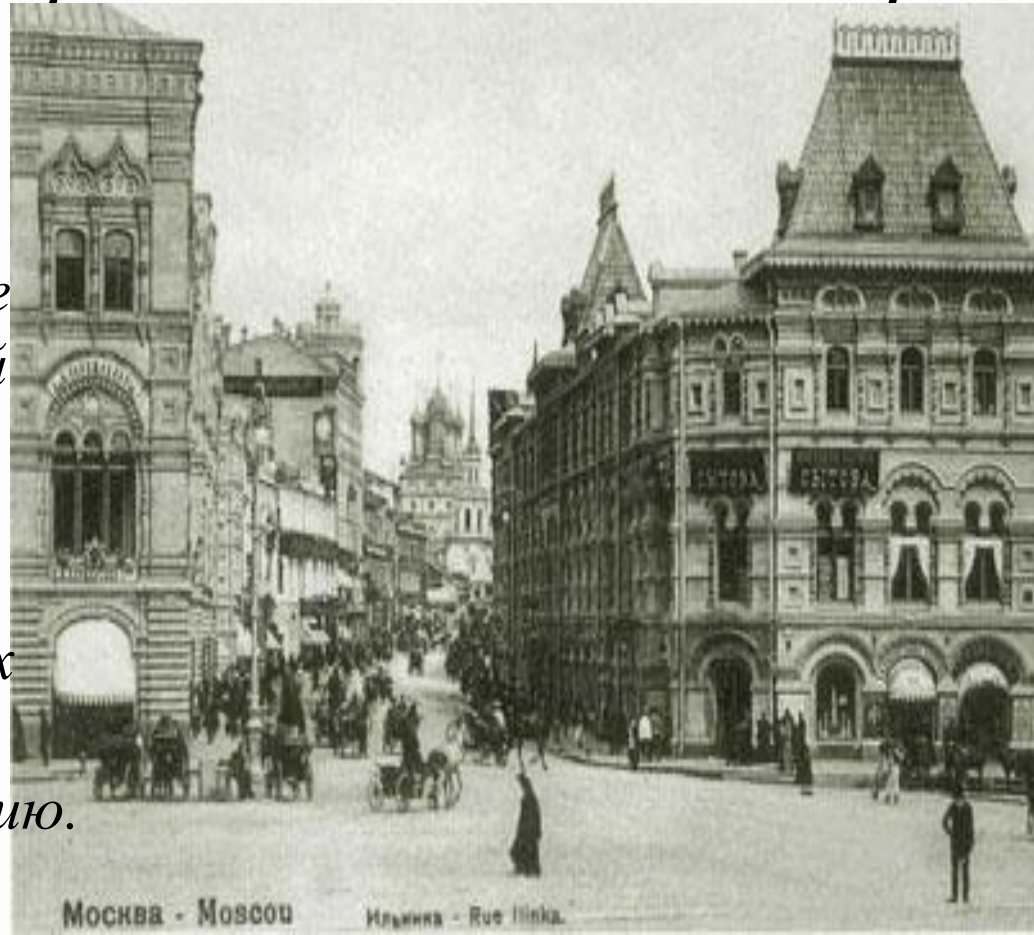
Москва - Moscow

Приказчики торговых компаний ездили «по городам и весям», разузнавая, какие товары больше нравятся жителям той или иной местности — кому лионский бархат, а кому английское сукно. Это делалось для того, чтобы товар не залеживался на складах и купцы не несли убытков, если привезут неподходящую продукцию.