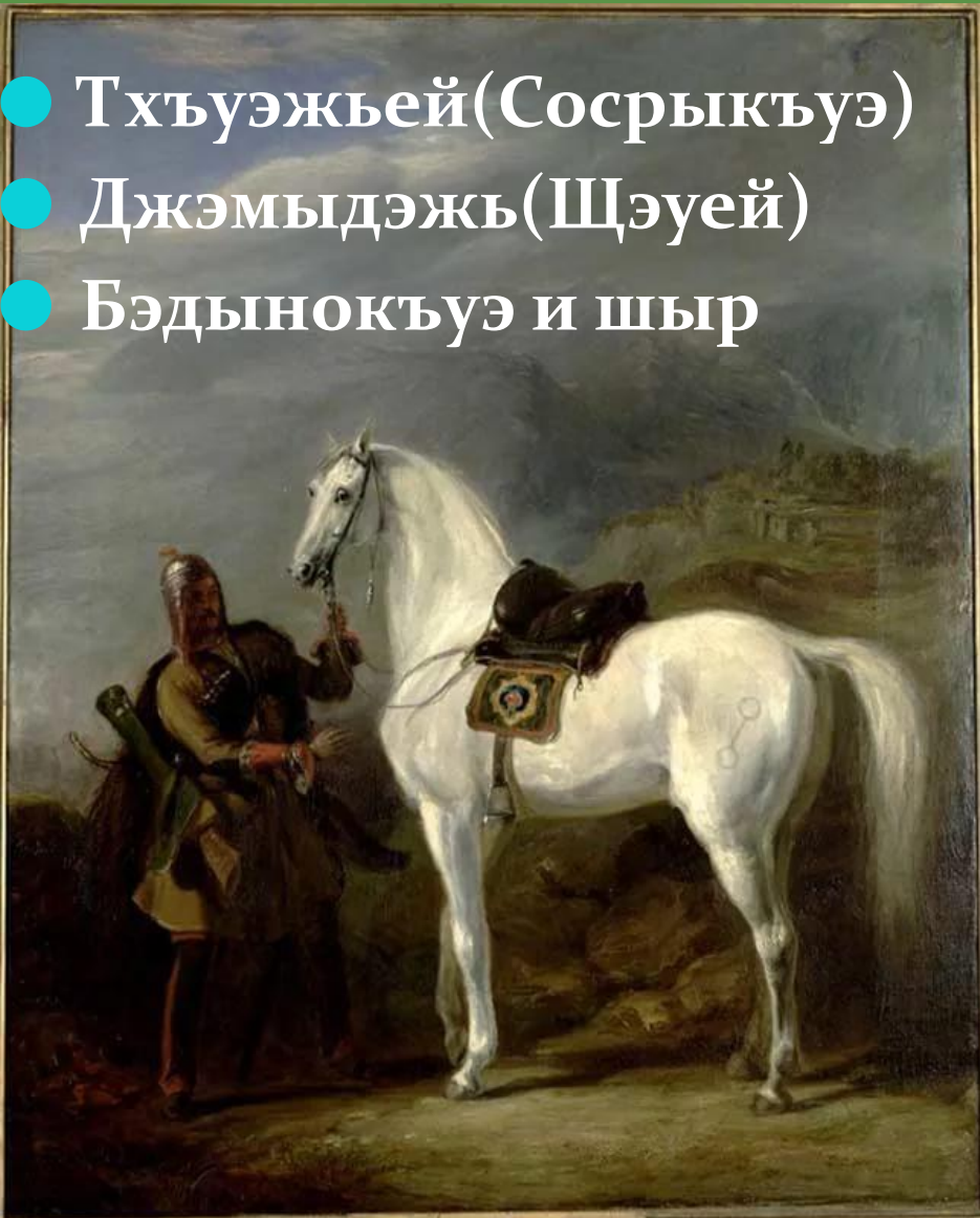
A. CIRCASSIAN CHIEF