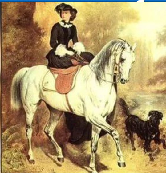
Фото 5. Же