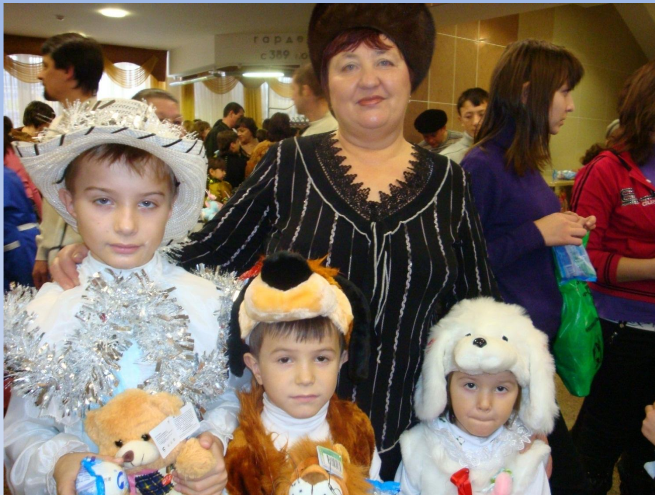
Новогодняя елка – 2011 год