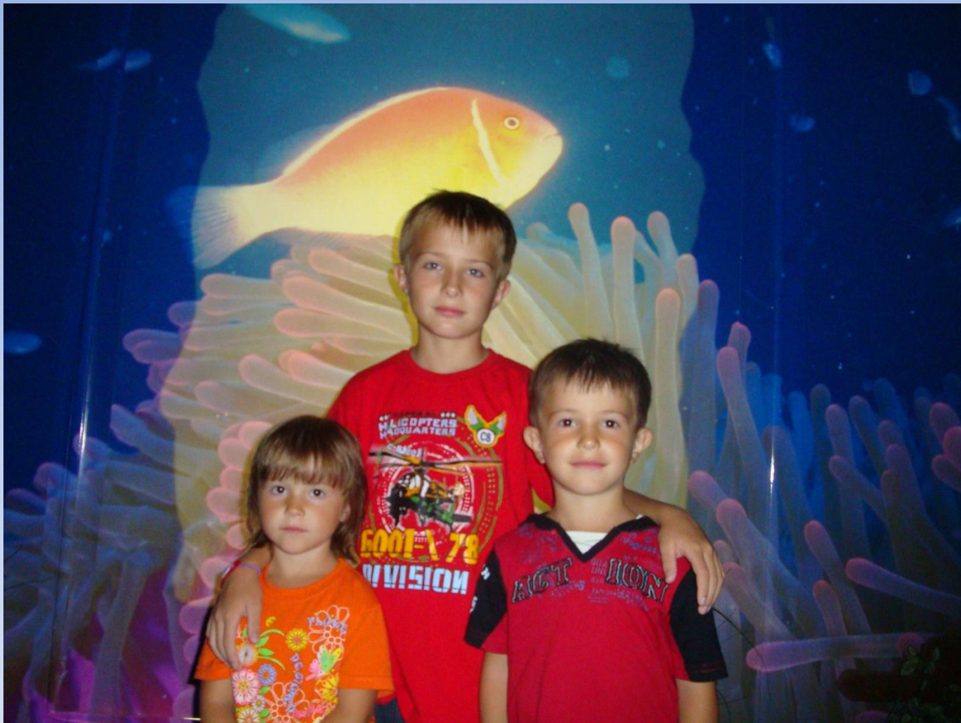
Аквапарк «Ривьера», Казань