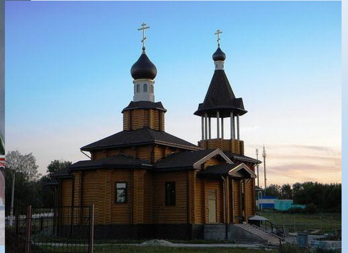
Храм Покрова Пресвятой Богородицы село Федосеевка