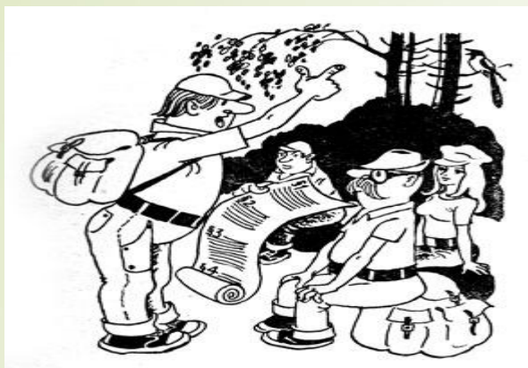
Пропаганда охраны природы среди туристов