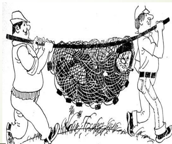
Привлечение к материальной ответственности