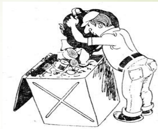
Бережное отношение к природе