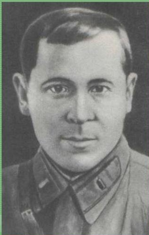
Муса Джалиль (Залилов Муса Мустафович)