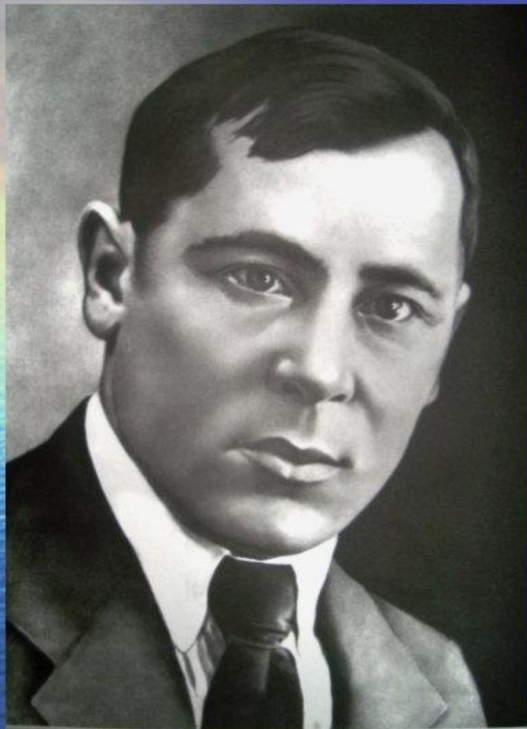
МУСА ЖӘЛИЛ (1906–1944)