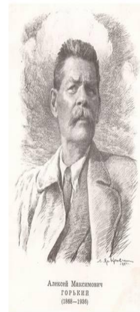
Алексей Максимович ГОРЬКИЙ (1868—1936)

Известный писатель Максим Горький сказал: «Книга, это великое чудо изо всех чудес, сотворенных человеком».