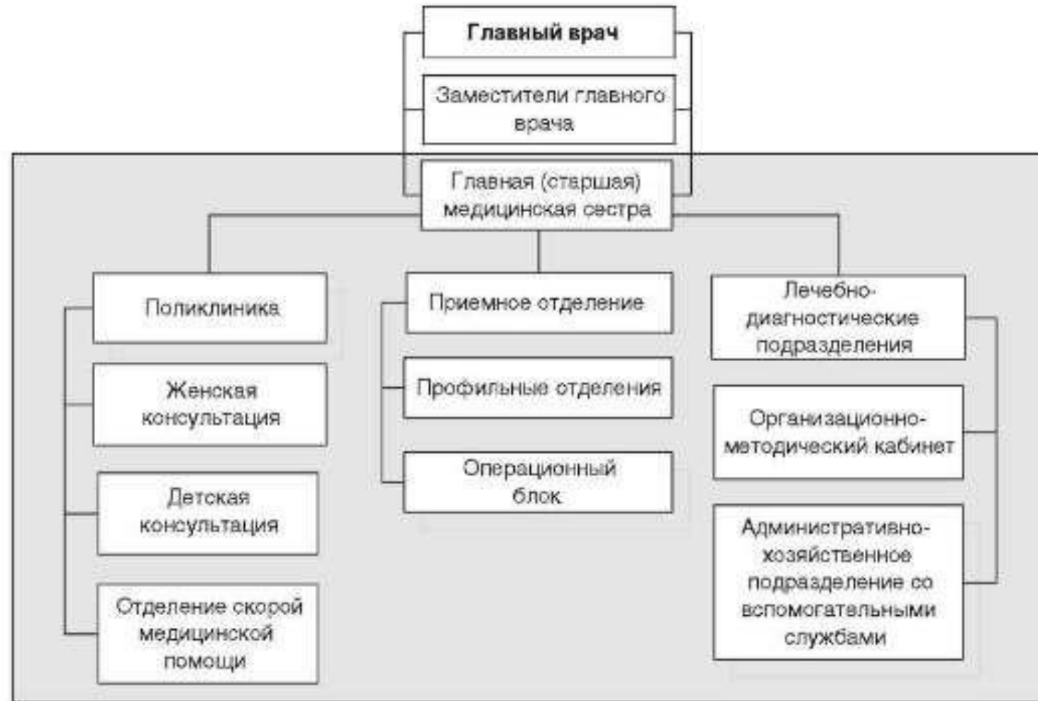
Центральная районная больница