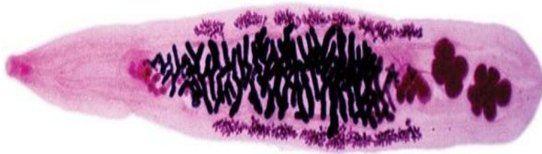
Кошачья двуустка ( Opisthorchis felinus )