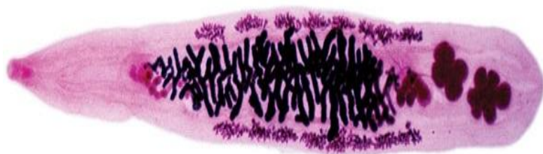
Кошачья двуустка ( Opisthorchis felinus )