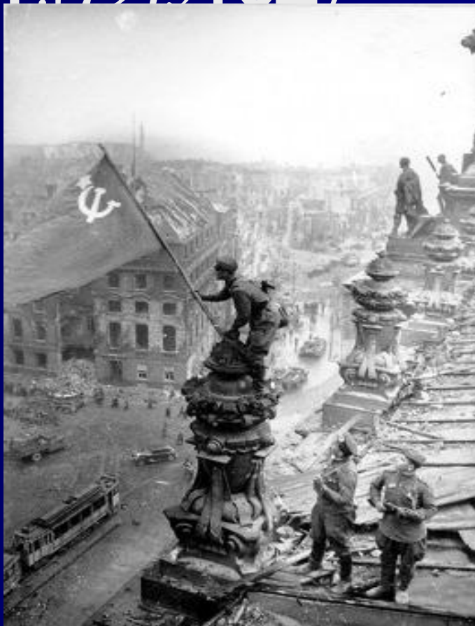
Знамя Победы над Рейхстагом

Великая Отечественная война явилась самым крупным вооруженным столкновением в истории человечества. На огромном фронте, простиравшемся от Баренцева до Черного морей, с обеих сторон в различные периоды сражались от 8 до 12 миллионов человек, применялось от 5 до 20 тысяч танков и самоходных артиллерийских установок, от 150 до 320 тысяч орудий и минометов, от 7 до 19 тысяч самолетов. Такого огромного размаха боевых действий и концентрации такой большой массы военной техники история войн еще не знала. На борьбу с поработителями встала вся страна. На фронте и в тылу людей всех наций и народностей объединяла