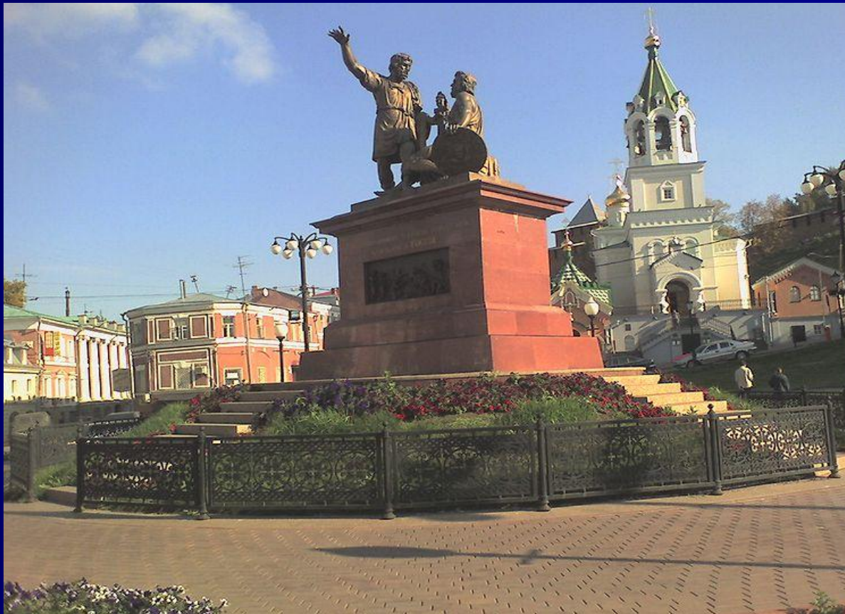
Памятник К.Минину и Д.Пожарскому в Нижнем Новгороде

4 ноября – День народного единства - День освобождения Москвы силами народного ополчения под руководством Кузьмы Минина и Дмитрия Пожарского от польских интервентов (1612 год)