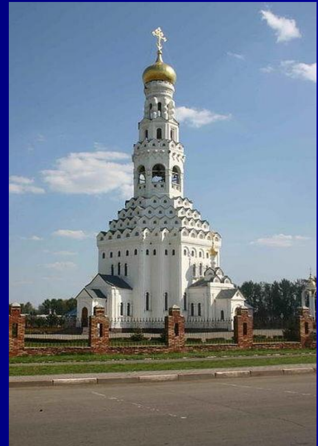
Собор в память о погибших на Прохоровском поле

За мужество и героизм свыше 100 тыс. воинов – участников битвы на Огненной дуге были награждены орденами и медалями. Битвой под Курском завершился коренной перелом в