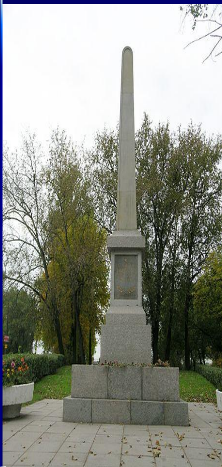
Обелиск защитникам Ленинграда

Одной из стратегических задач, поставленных руководством фашистской Германии перед вооруженными силами в плане "Барбаросса", являлся захват крупнейшего промышленного и политического центра СССР города Ленинграда. В течение 1941-1944 гг. в районе города проходил целый ряд оборонительных и наступательных операций, которые в целом можно назвать "битва за Ленинград". В этой битве были задействованы значительные силы войск, техники и мирного населения. С 10 июля 1941 г. начинаются ближние бои на подступах к городу. Соединения Советской армии и 10-й дивизии народного ополчения сумели на "Пулужском рубеже" замедлить наступление немецких войск и мобилизовать все силы для обороны. 8 сентября 1941 года удается блокировать город с суши. В условиях блокады город находился до 27 января 1944 г.