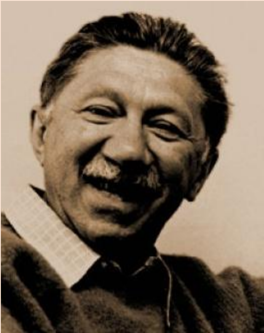
Абрахам Маслоу (1908 – 1970 гг.)

«Я совершенно убежден, что человек живет хлебом единым только в условиях, когда хлеба нет. Но что случается с человеческими стремлениями, когда хлеба вдоволь и желудок полон? Появляются более высокие потребности, и именно они, а не физиологический голод, управляют нашим организмом. По мере удовлетворения одних потребностей возникают другие, все более и более высокие. Так, постепенно, шаг за шагом, человек приходит к потребности в саморазвитии – наивысшей из них»