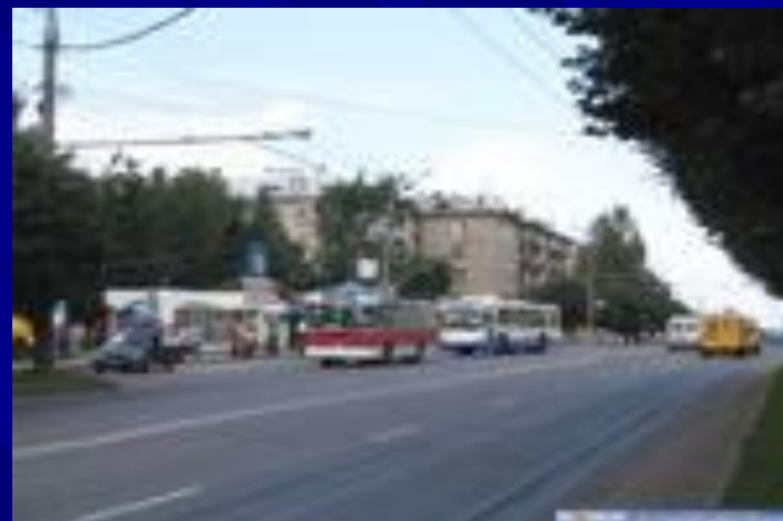
Остановка имени А. Г. Николаева