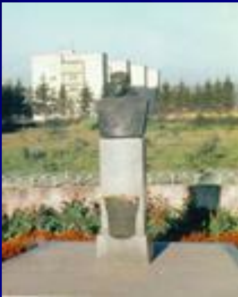
Бюст А. Г. Николаева на родине космонавта в селе Шоршелы