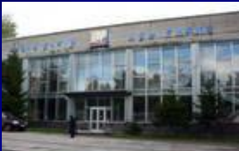
Улица имени А. Г. Николаева