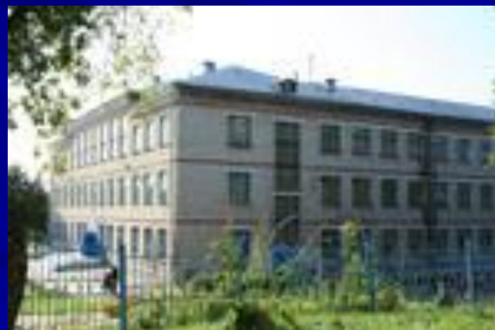
Школа №10 имени А. Г. Николаева