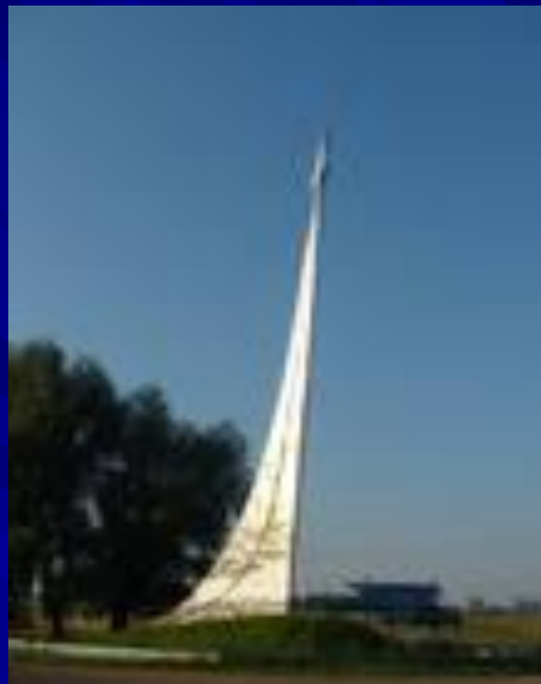
При въезде в село Шоршелы в 1974 году установлена стела- ракета