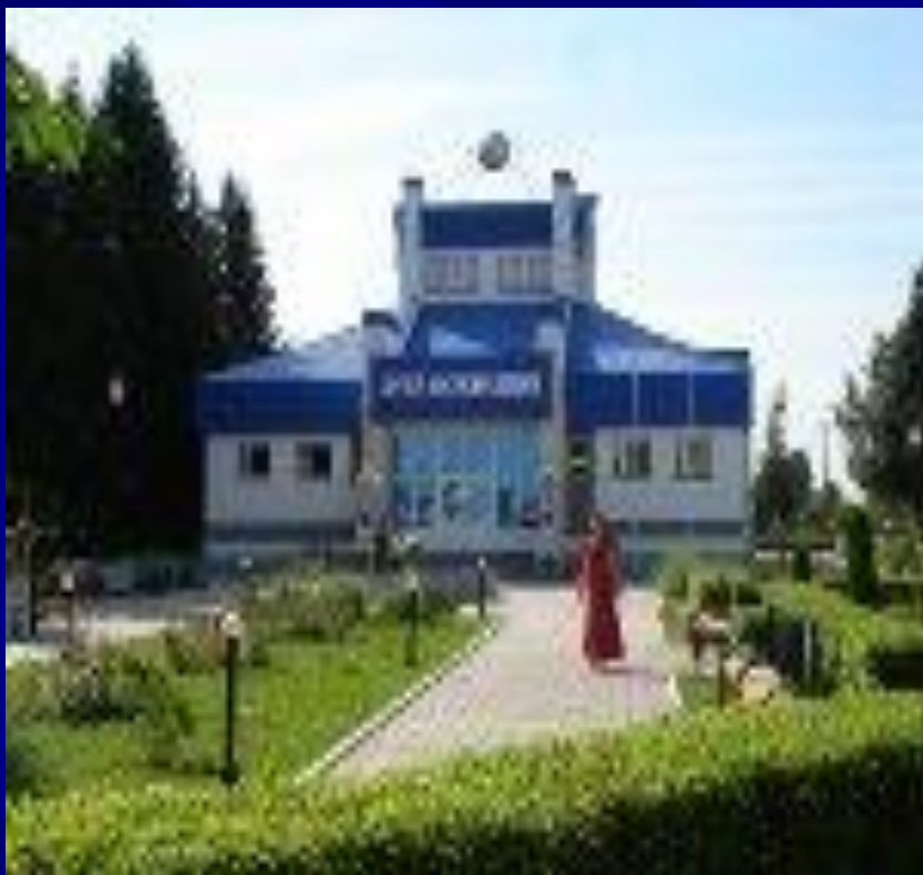
Село Шоршелы. Музей Космонавтики.