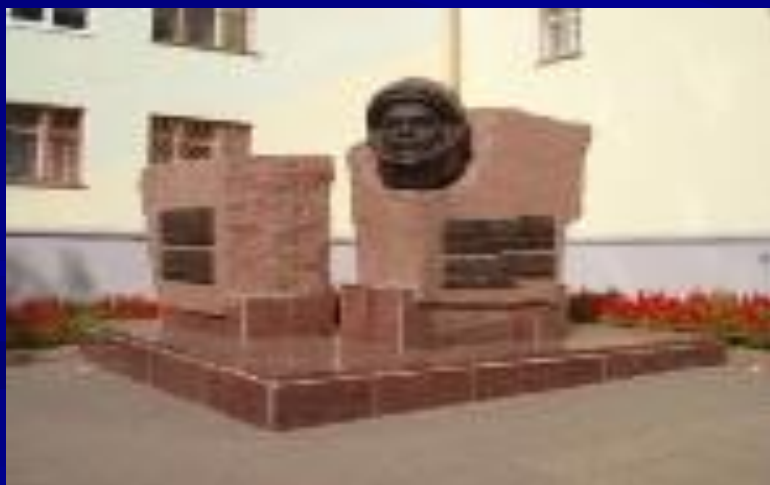
Памятник А. Г. Николаеву