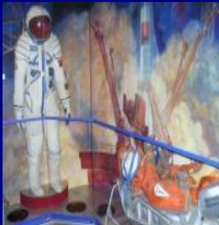
Музей Космонавтики (внутри)