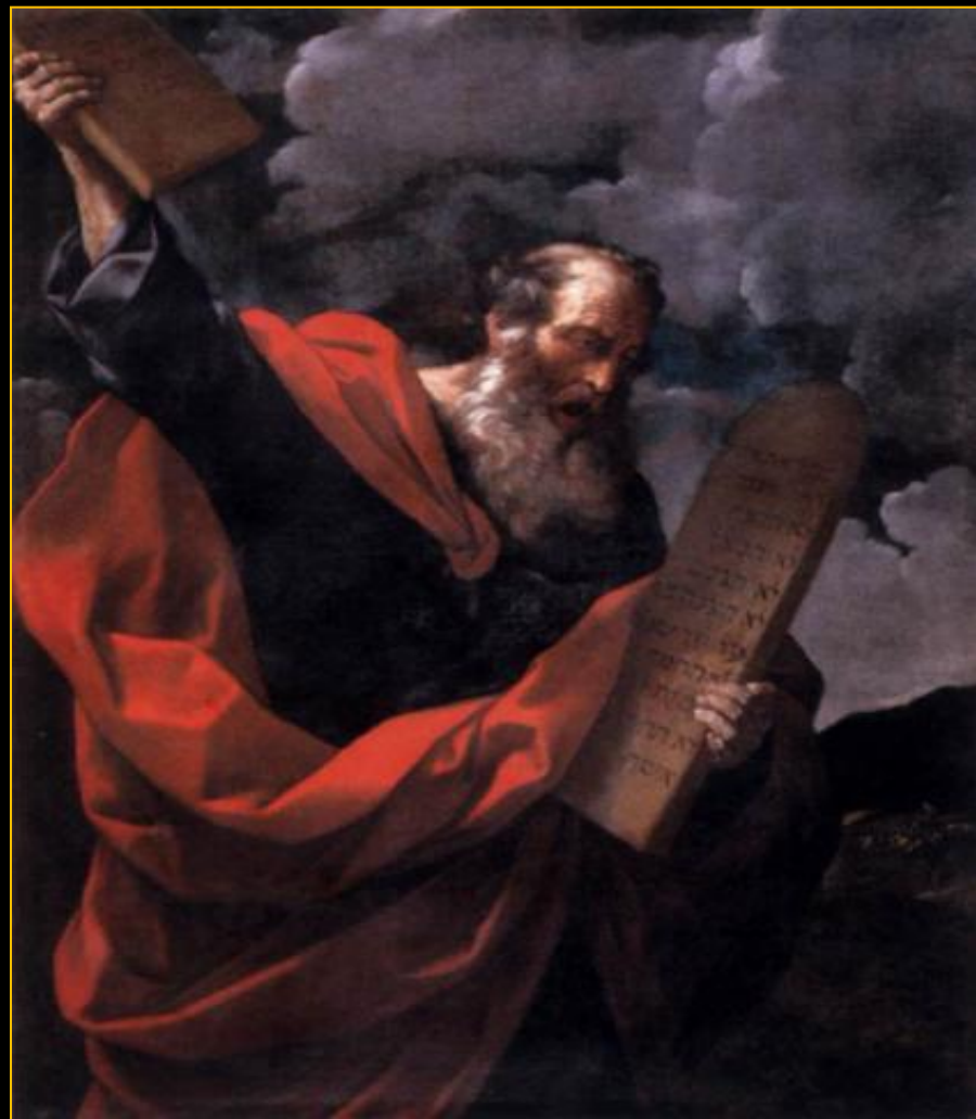
пророк Моисей со скрижалями