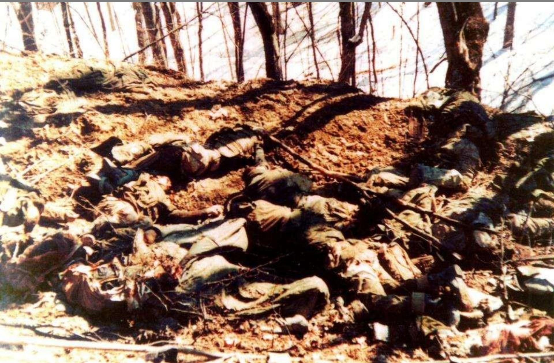
Погибшие Герои Герои