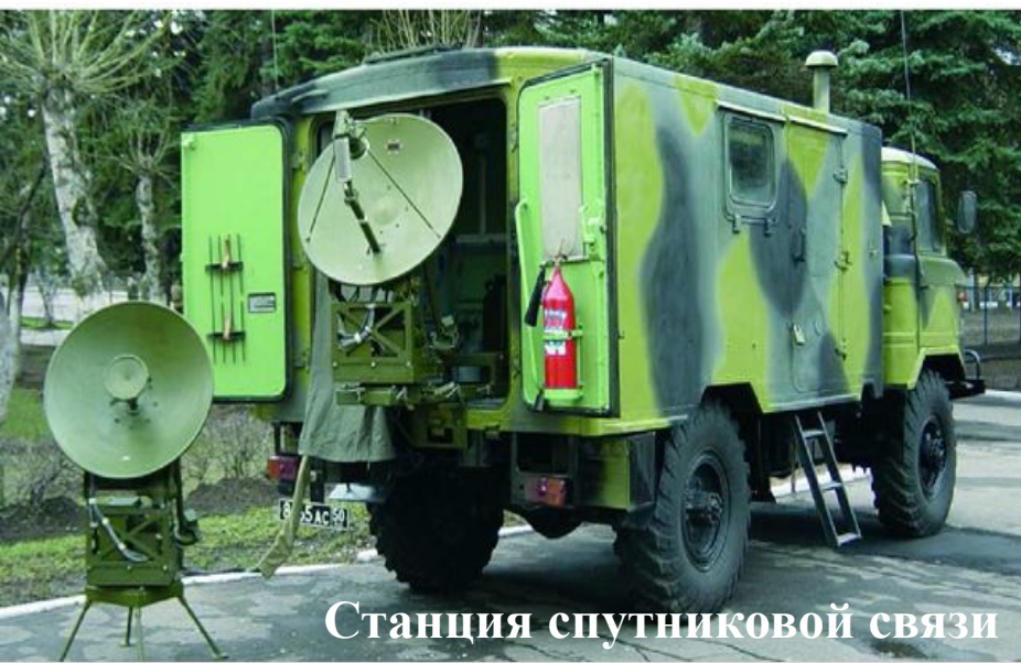
Станция спутниковой связи

до широко разветвленных многоканальных автоматизированных систем