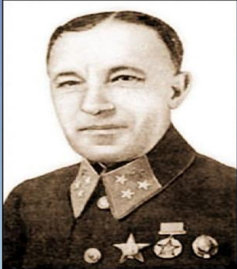
Дмитрий Михайлович Карбышев. Герой Советского Союза