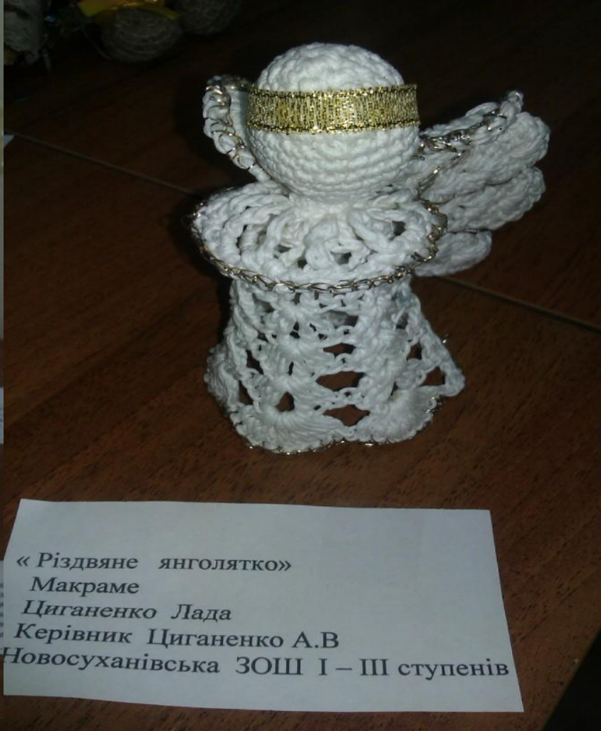
«Різдвяне янголятко» Макраме Циганенко Лада Керівник Циганенко А.В Новосуханівська ЗОШ І – III ступенів