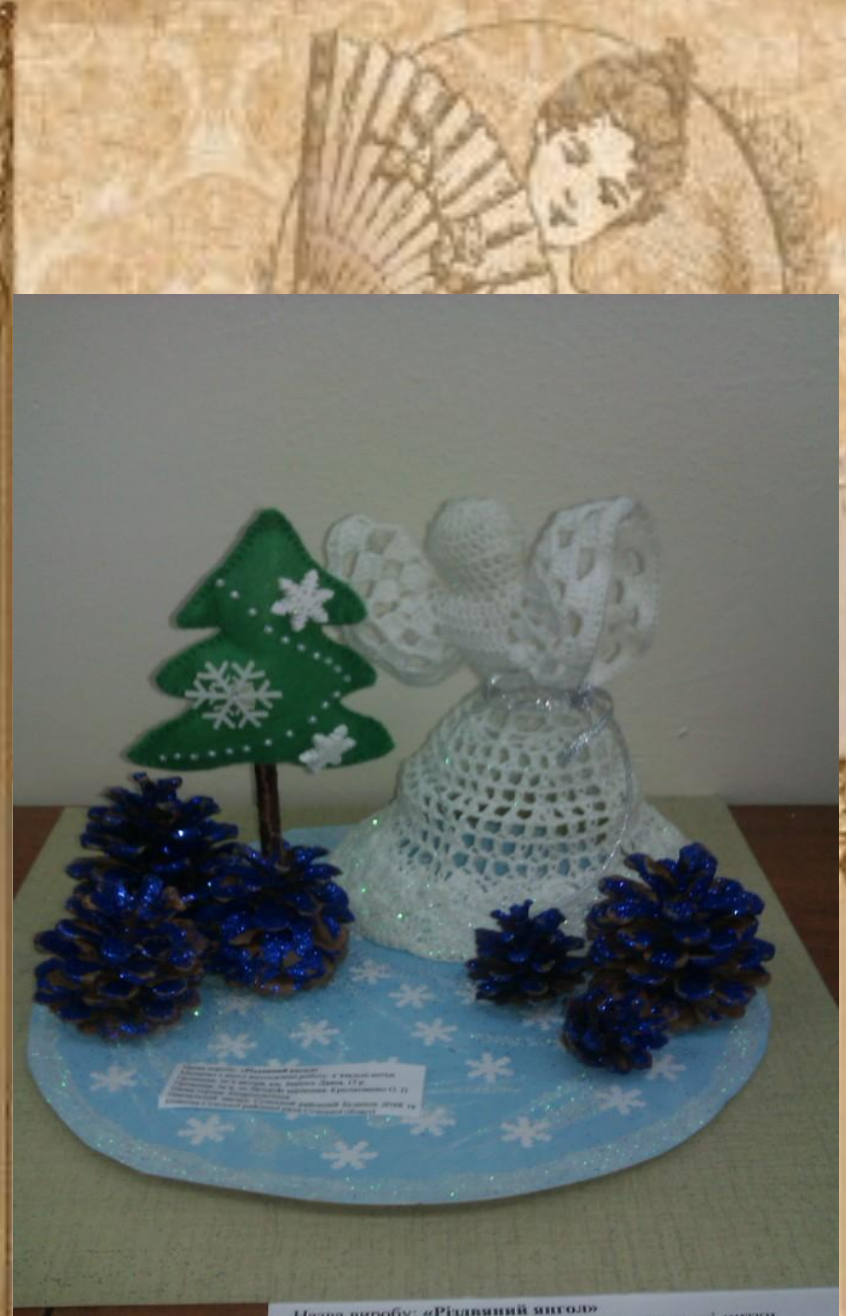
Назва виробу: «Різдвяний ангел» Матеріал: папір, нитки, в'язальні спиці