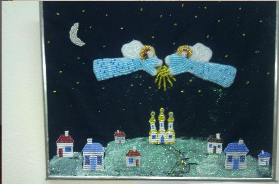
Назва виробу: «Ніч перед Рідном» Матеріал з якого виготовлено роботу: бязь