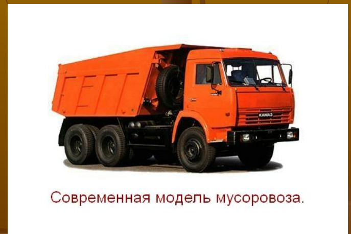
Современная модель мусоровоза.