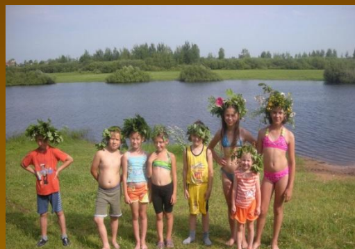
Бронница. Участники акции "Чистый берег" после работы.