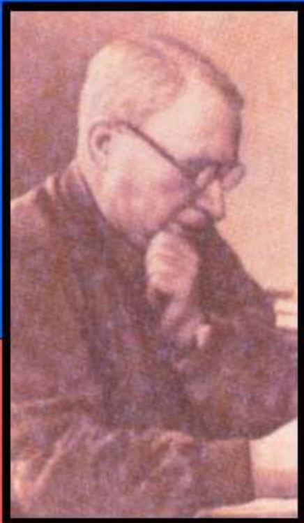
слова Коца А.Я.

«Интернационал» впервые прозвучал в январе 1918 г. и оставался гимном РСФСР, а затем СССР до 1944 г.