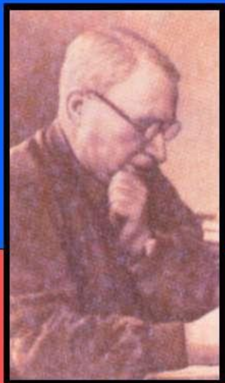
слова Коца А.Я.

«Интернационал» впервые прозвучал в январе 1918 г. и оставался гимном РСФСР, а затем СССР до 1944 г.